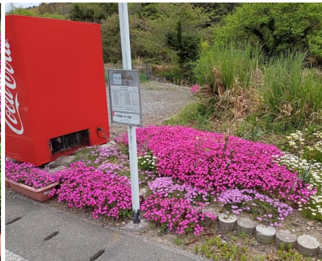
国道沿いの花壇にもシレネを移植