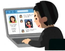
感染した人の住所や勤務先の詮索、拡散