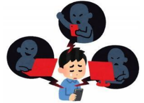
インターネット、SNSでの誹謗中傷やデマの拡散