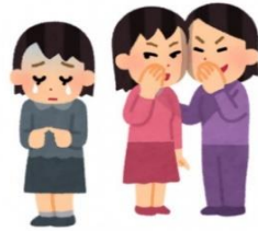
感染した人及びその家族に対するいじめ

「家族を感染から守りたい」という気持ちは誰もが持っているものです。そのような動機は間違っていないかったとしても、会話の中のひとことが重要な仕事をしている人々への攻撃になってしまうことがあります。苦しむ必要のない人を傷つける言動はやめて、互いに思いやりを持ち、正しい理解に基づいて行動することを、今、改めて考える時ではないでしょうか。（法務省ホームページより抜粋）