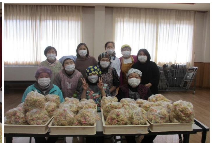
婦人会メンバーで記念撮影