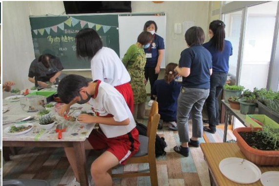
社協の皆さんも集まりました。