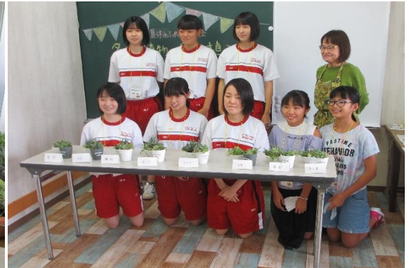
みんなで一緒に記念撮影