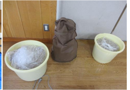
出来上がった味噌です。