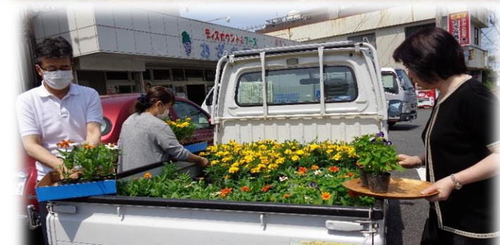
6月8日に花苗受取る平城商店街のにこにこ会 (約27人)

馬瀬老人クラブとチーム馬瀬の21人は、花壇いっぱいマリーゴールドを植えました。(写真左上) 平城商店街のにこにこ会の約27人には、マリーゴールドや夏スミレなどの花苗を配り、各店頭のプランターに植えました。(写真左下) 深泥青年部の13人は、ポチュラカやマリーゴールドなどを配色よく植えました。(写真右下) 深泥青年部の方は「朝早かったから、暑くなくてよかった。」と話されました。皆さん植えた後は、満足そうな笑顔がとても印象的でした。これから暑い季節は、水やりや草引きの世話が大変ですが、よろしくお願ひします。いつも地域の環境美化活動にご協力いただき、ありがとうございます。