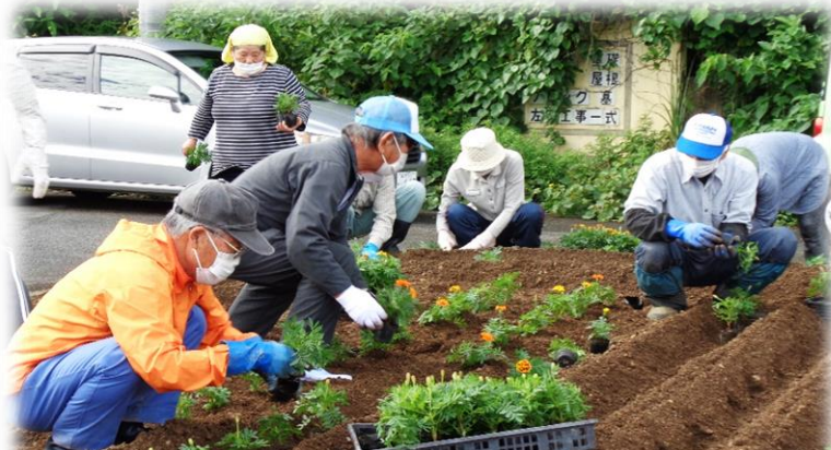
6月6日に花植える馬瀬老人クラブとチーム馬瀬 (21人)

馬瀬老人クラブとチーム馬瀬の21人は、花壇いっぱいマリーゴールドを植えました。(写真左上) 平城商店街のにこにこ会の約27人には、マリーゴールドや夏スミレなどの花苗を配り、各店頭のプランターに植えました。(写真左下) 深泥青年部の13人は、ポチュラカやマリーゴールドなどを配色よく植えました。(写真右下) 深泥青年部の方は「朝早かったから、暑くなくてよかった。」と話されました。皆さん植えた後は、満足そうな笑顔がとても印象的でした。これから暑い季節は、水やりや草引きの世話が大変ですが、よろしくお願ひします。いつも地域の環境美化活動にご協力いただき、ありがとうございます。