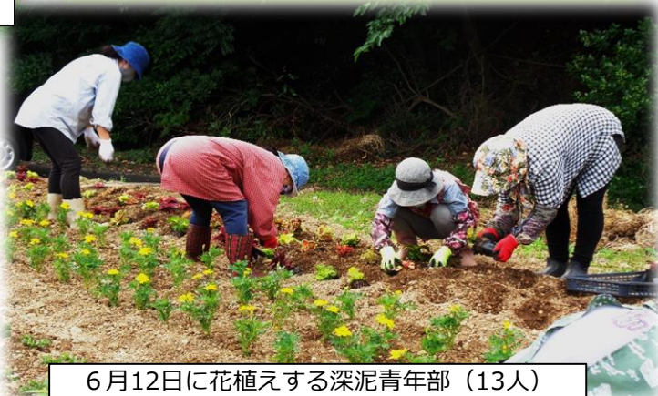
6月12日に花植える深泥青年部 (13人)