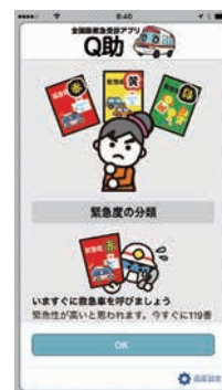
緊急度の分類説明