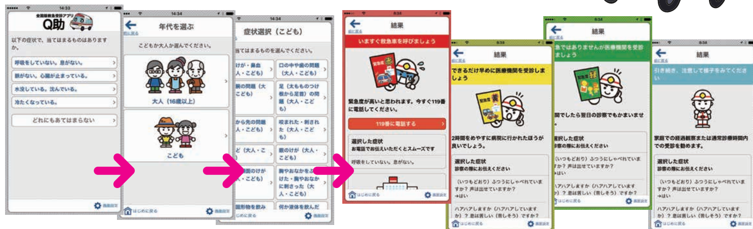
1 緊急度の高い 症状選択