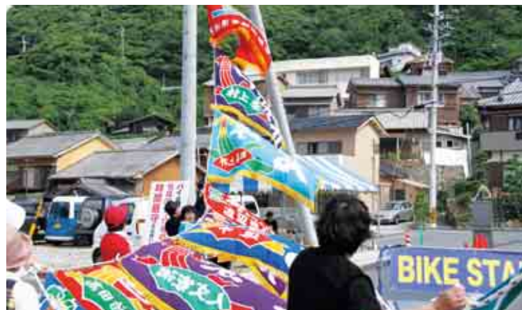
いやしの郷トライアスロン大会の名物ともいえる大漁旗も選手を見守ります。大会を盛り上げようとする地元住民の方々の奮闘が光ります。