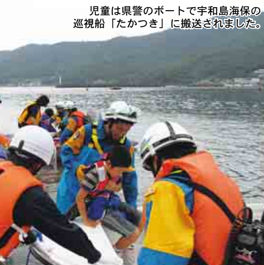
児童は県警のボートで宇和島海保の巡視船「たかつき」に搬送されました。