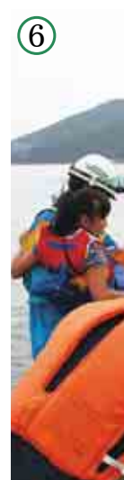
写真 1 6/ 17 癒しの果実でお接待を

長崎保育所年長組の園児 6 名が、南宇和高校農業科の 3 年生 12 名に協力してもらいながら、御荘菊川の国道 56 号の遍路道沿いに「接待木」として愛南ゴールドの苗木 10 本を植えました。