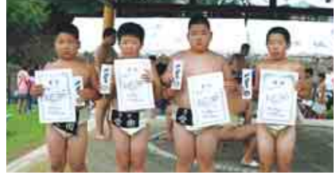
小学生の部で入賞した皆さん