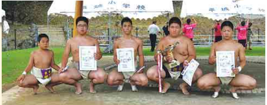
御荘中相撲部の皆さん