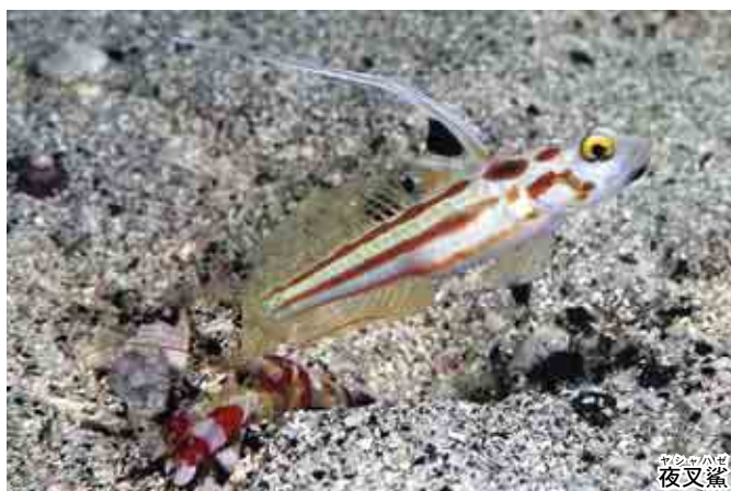
ヤシャハゼ 夜叉鯨

夏になると怪談をよく耳にするようになる。怖い話で夏を涼しく乗り切ろうとする江戸時代からの知恵だそうだ。