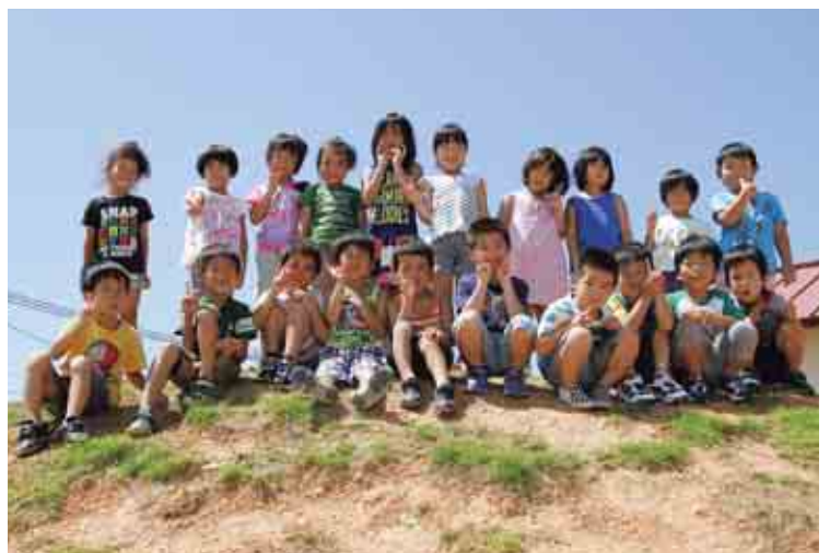
城辺保育所 きりん組