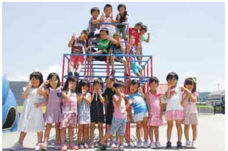
城辺保育所 らいおん組