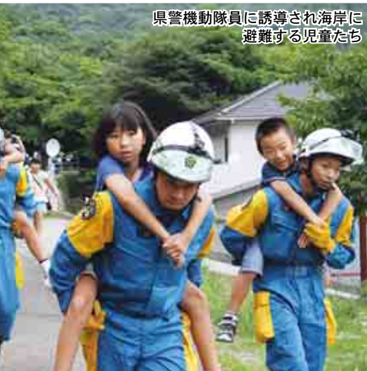
県警機動隊員に誘導され海岸に避難する児童たち