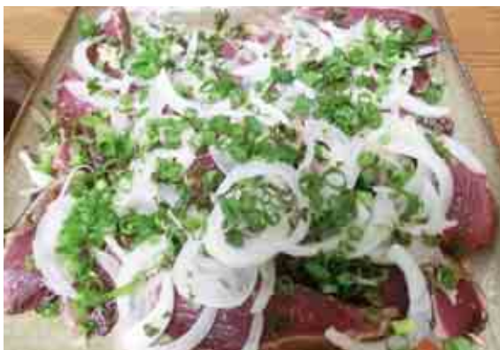
見事なカツオのたたきが出来上がりました。自ら調理したカツオのたたきは格別の味です。

新緑が映える4月から6月頃までのカツオは臭みがなく、甘みがあり、もちもちとした食感が特徴です。また、8月下旬から10月頃水揚げされる「戻りカツオ」も絶品です。「カツオのたたき作り体験」は、町内はもとより町外の方の参加も大歓迎です。ぜひ水揚げ地ならではの鮮度抜群のカツオの食感を味わってください。