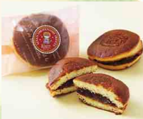
なーしくんどら焼き