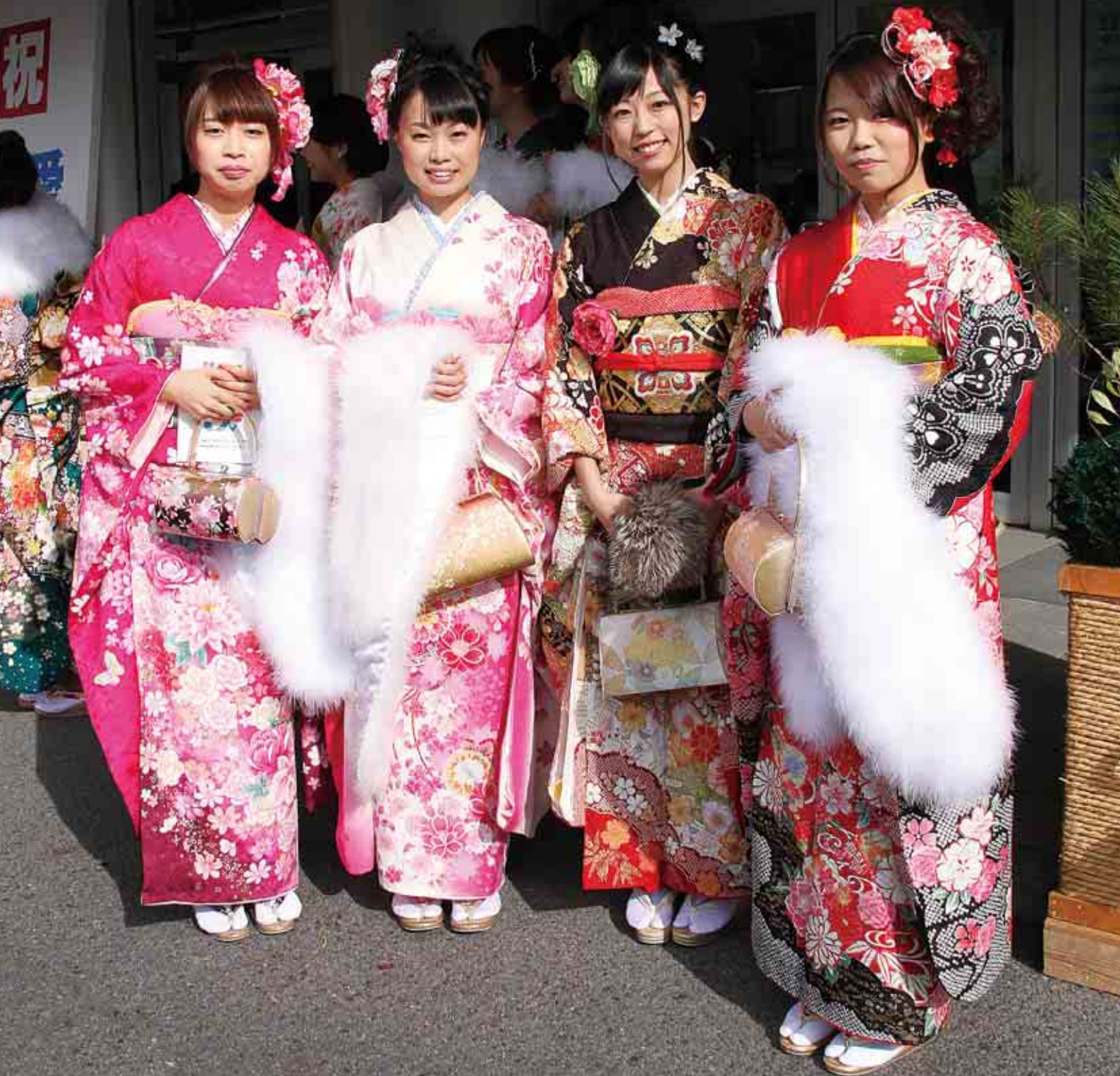
表紙写真：愛南町成人式