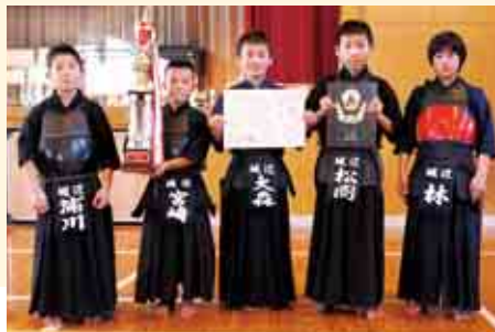
団体戦低学年の部優勝 城辺子供剣道会 A