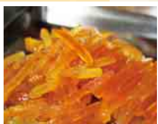
◀チョココーティング前の材料

「あいなんゴールドオレンジ」、「文旦オレンジ」は、それぞれ愛南ゴールドと文旦の果皮を砂糖漬けしたものに、チョコレートをかけています。材料は果皮、砂糖、チョコレートのみで、果皮のほろ苦さとチョコレートの相性の良いお菓子です。愛南ゴールドも文旦も、個々で大きさも違いは果皮やワタの厚さも違うため、大きさを揃えるのに大変苦勞します。1本1本チョコレートをコーティングして、乾燥させると、かなり手間ひまかかっています。