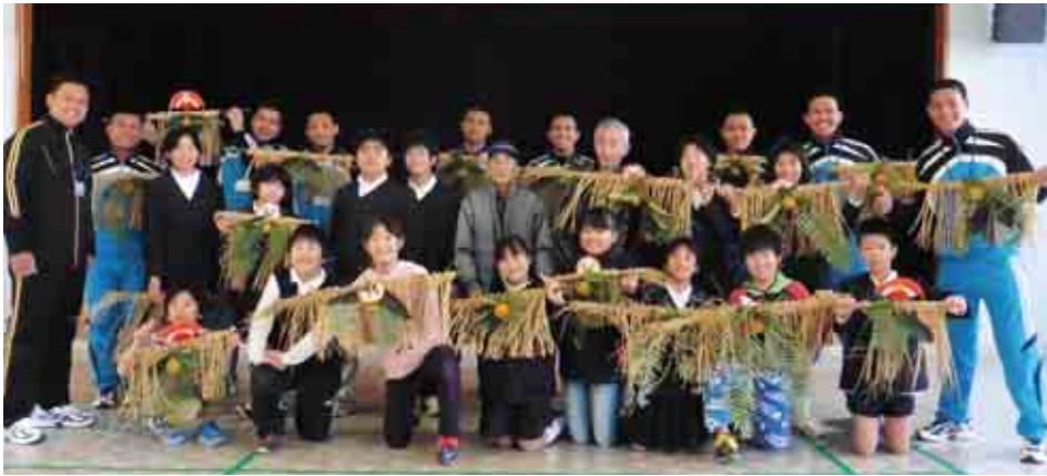
12月下旬、中浦小学校でしめ縄づくりを体験しました。

定しているそうです。短い期間ですが、日本の文化に触れながら漁業技術を習得し、本国に帰っても日本の良き理解者として活躍してもらいたいと願っています。