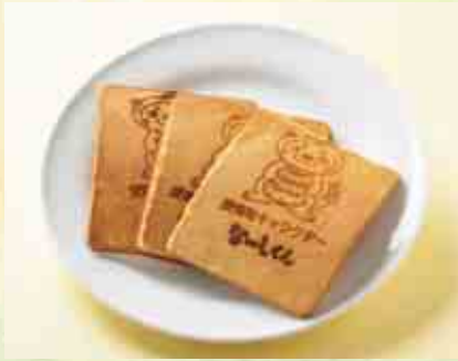
なーしくんせんべい