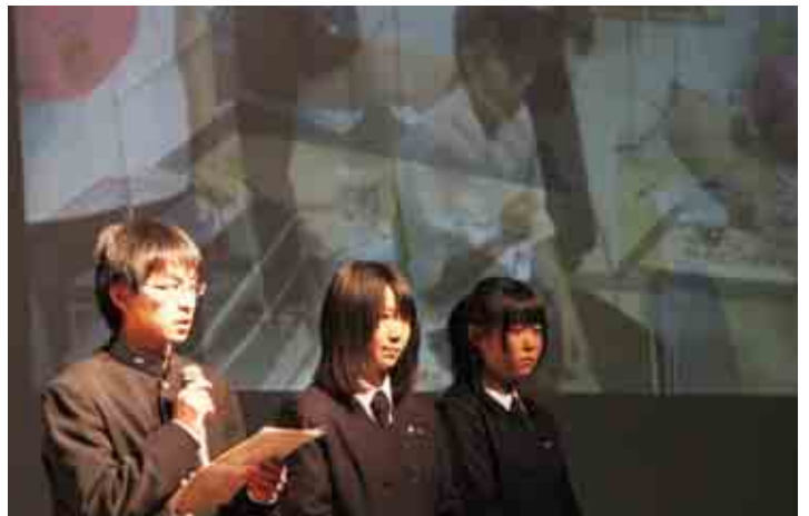
東北から招いた8名の皆さんは、被災地での経験を基に、愛南町に向けた熱いメッセージを送りました。