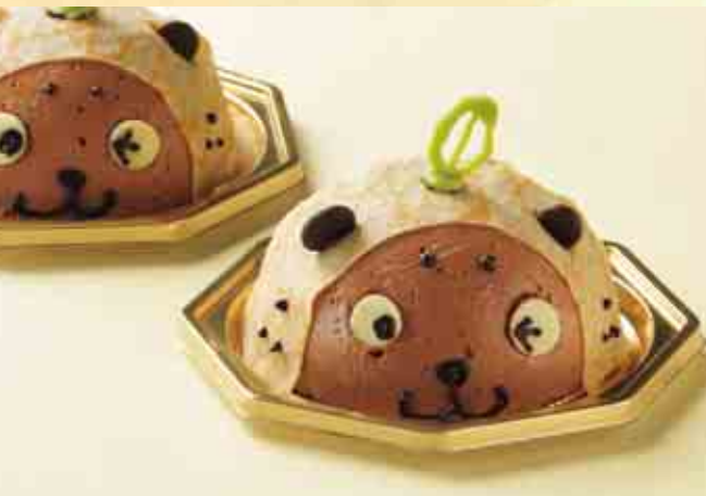
なーしくんのチョコムース

チョコレートムースには愛南ゴールドのピールを混ぜてあります。中にも愛南ゴールドのゼリーを入れてあります。愛南町となーしくんにちなんだものということで、こういう形になりました。小さなお子さんや女性にはチョコが人気なので、少し色黒ななーしくんになりました。