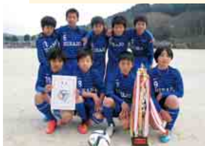
1部 A 優勝 平城 SC A