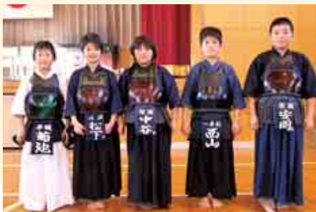
個人戦の優勝、準優勝者