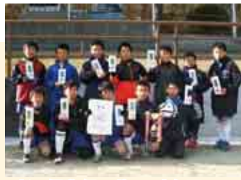
1 部 B 優勝 緑スポーツ少年団