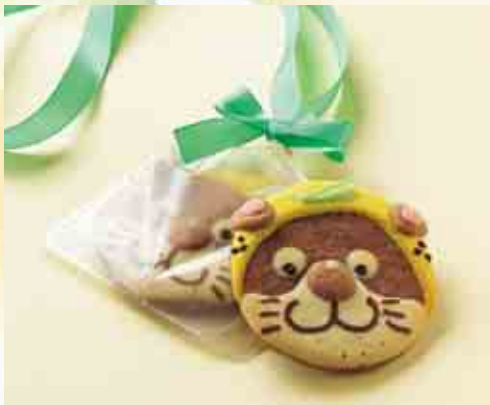
なーしくんメダルクッキー