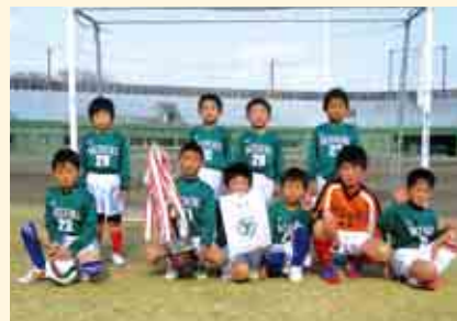
3部優勝 緑スポーツ少年団