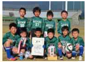
3 部優勝 緑スポーツ少年団