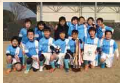
2部優勝 平城 SC A