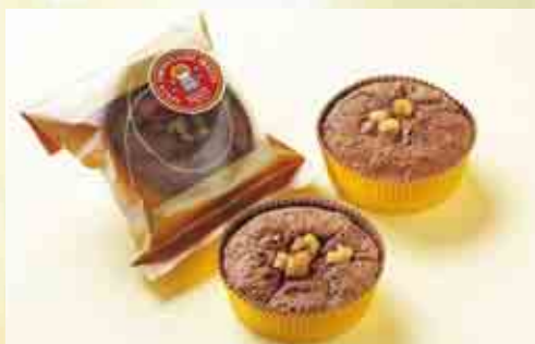
あいなんショコラ

「あいなんゴールドオレンジ」、「文旦オレンジ」は、それぞれ愛南ゴールドと文旦の果皮を砂糖漬けしたものに、チョコレートをかけています。材料は果皮、砂糖、チョコレートのみで、果皮のほろ苦さとチョコレートの相性の良いお菓子です。愛南ゴールドも文旦も、個々で大きさも違いは果皮やワタの厚さも違うため、大きさを揃えるのに大変苦勞します。1本1本チョコレートをコーティングして、乾燥させると、かなり手間ひまかかっています。