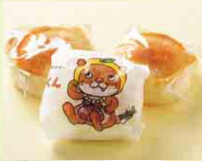
なーしくんまんじゅう