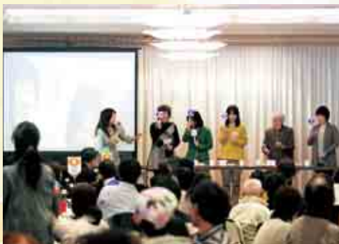
隠し味として愛南町の特産品が使用されているスイーツを当てる「利きスイーツコンテスト」の様子

なーしくんをモチーフに、お土産用として開発したスイーツが楽しめる「なーしくんのおもてなーしスイーツフェスタ」が、ホテルサンパールで開催されました。「スイーツフェスタ」は、愛南町合併10周年を記念して今年初めて行われ、町内の7業者から新開発のスイーツ9品を含む13品が出品されました。スイーツはバイキング形式で楽しむことができ、町内外から参加した約160名の親子連れなどが、出品者が試行錯誤して完成させた「おもてなーしスイーツ」を堪能しました。