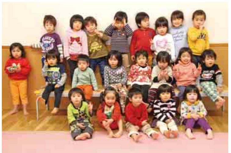
はまゆう乳幼児保育所