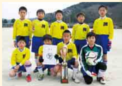
1部 B 優勝 緑スポーツ少年団