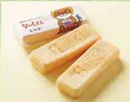
なーしくんもなか

「なーしくんせんべい」はしょうが味、お子さんにも食べやすい味になるように工夫しています。「なーしくんもなか」の中は愛南町特産の愛南ゴールド味のアんこで、「なーしくんまんじゅう」は黄身ミルク味です。香料は使わず、自然の風味、味わいを大切にしています。 商品に使用している刻印は長いお付き合いのある、確かな技術を持った職人さんに作ってもらいました。