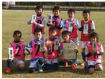
2 部優勝 平城 SC B