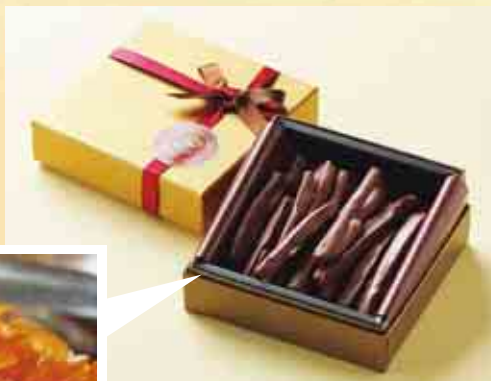
あいなんゴールドオレンジ