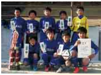
1 部 A 優勝 平城 SC A