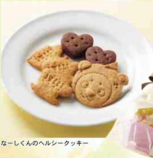
なーしくんのヘルシークッキー

「なーしくんのヘルシークッキー」は、4種類で1セットです。プレーンのなーしくん、ココアの愛南ゴールドジャムサンド、しょうが、豆乳きなこの味です。卵とバターを使わず、砂糖も、きびやメープルなど体に良いものを代わりに使って甘みをつけています。地元産のしょうが、愛南ゴールドを使い、小さなお子さんからご年配の方まで安心して食べられる、体に優しいクッキーを作りました。