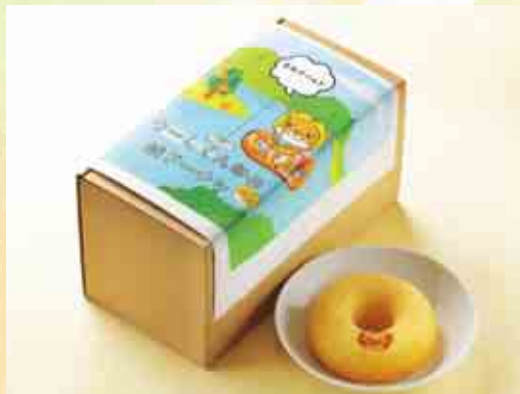
なーしくん印の焼きドーナツ