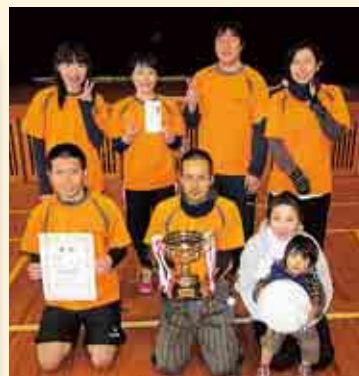
1 部優勝 ゴーヤンズ