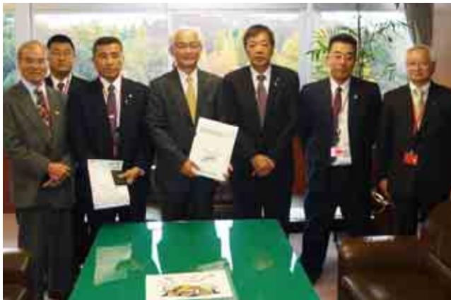
今回の道路整備促進要望に参加した方々

議長や会員市町村職員のほか愛媛・高知両県の関係職員の総勢19名で、国土交通省幹部職員などに対し、南海トラフ巨大地震など災害時の『命の道』としての機能や地域経済の活性化が望める高速道路「四国8の字ネットワーク」の早期整備促進(特に、「津島道路」岩松く内海間の早期工事着手、内海く宿毛間の早期事業化)についての重要性、緊急性を強く訴えました。