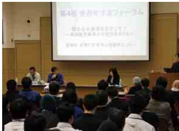
前回の水産フォーラムの様子