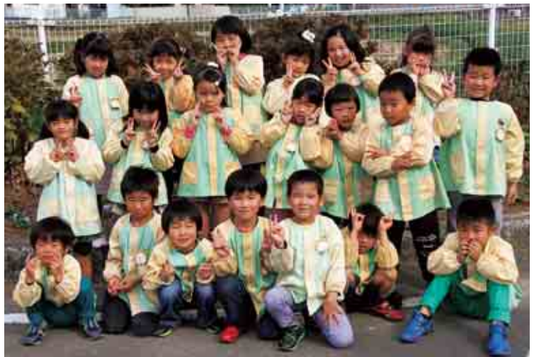
城辺保育所 らいおん組