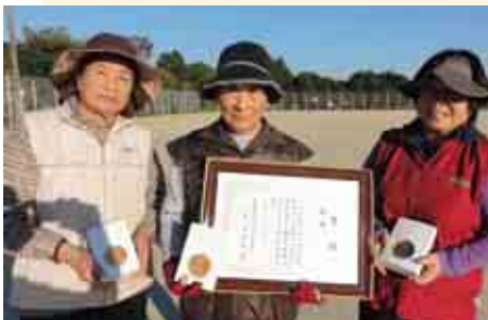
山出 A の皆さん