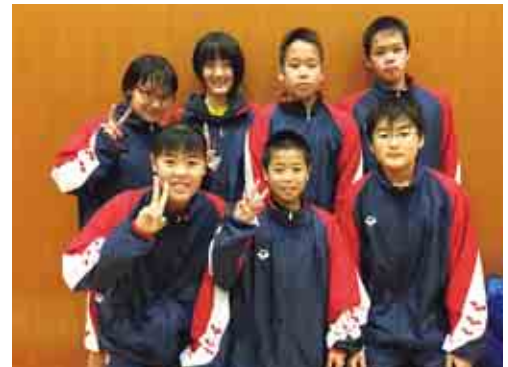
大会に出場した皆さん