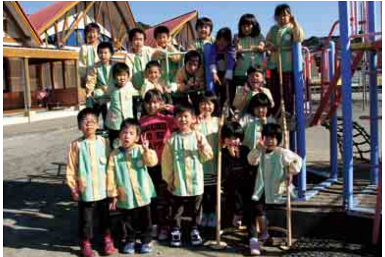
城辺保育所 きりん組