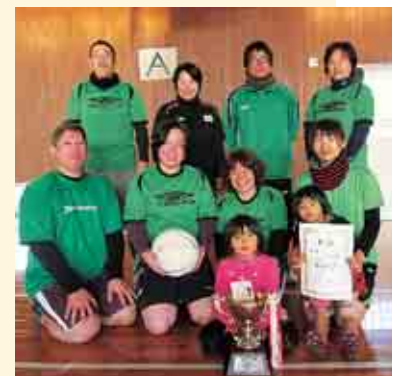
2 部優勝 クラブおんびき