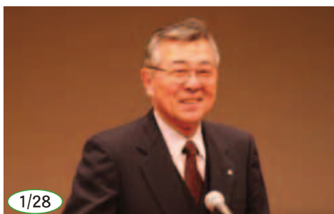
1/28 町民環境学習会でのあいさつ