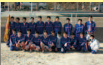
中学校の部 一本松