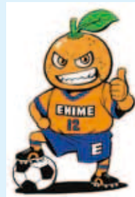
画：愛媛県出身漫画家 能田達規