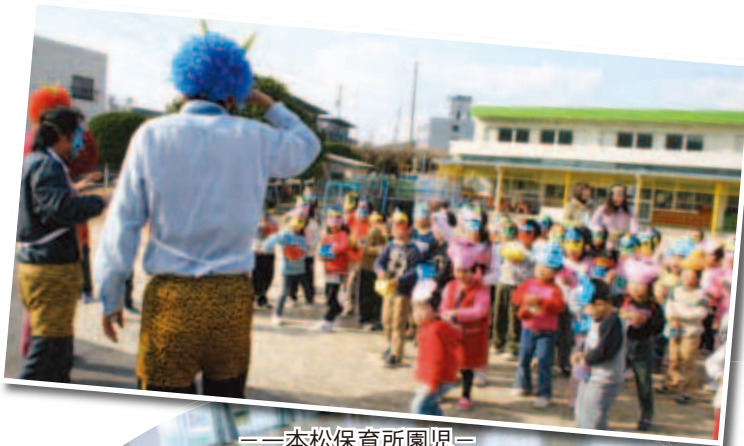
—一本松保育所園児—