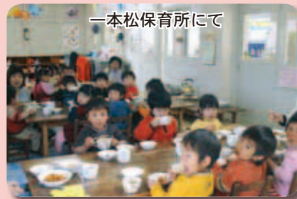
—一本松保育所にて