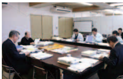
平成18年度予算査定

1月は、総合計画新規事業協議(16日)、愛媛県町村会全員連絡会(17日、松山市)、臨時議会、総合計画・中長期財政計画協議(18日)、国道56号道路改良及び高速道路等を知事に要望(19日、松山市)、第2回えひめメッセ首都圏商談会視察他(24・25日、東京都)、えひめ味覚フェア(27日、松山市)、全国町村会定期総会(27日、東京都)、宇和島ブロックごみ処理広域化計画推進協議会(31日)などに出席しました。