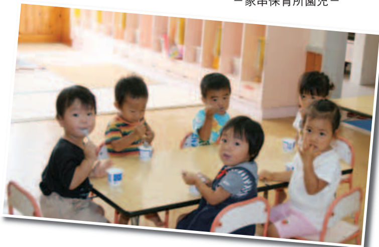
一家串保育所園児