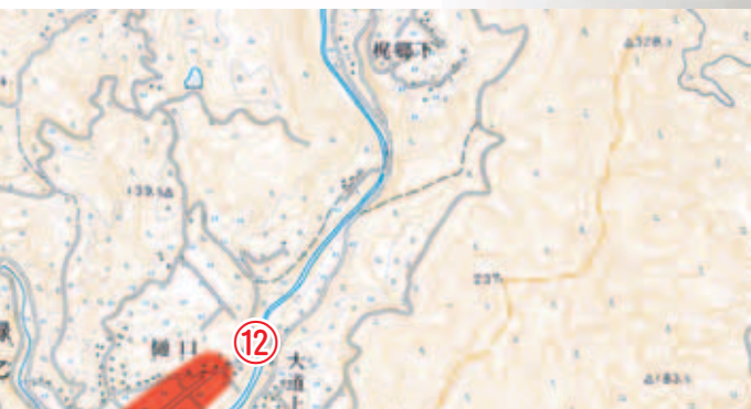
平成17年中(9月末まで)の交通人身事故多発地点

大幅に増えている交通事故に歯止めをかけるため、皆さん一人ひとりが安全運転に気を付けましょう。 緑地区の「緑新鮮市」前の交差点な