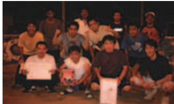
準優勝 北裡チーム