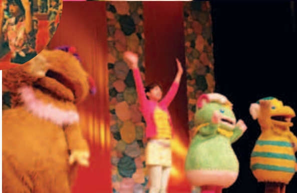
合併一周年記念式典