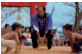
はっけよい、のこった!

ちびっ子力士大活躍——自王神社奉納相撲大会——今年も9月18日(旧暦8月15日)に豊漁等を願う奉納相撲大会が、自王神社境内で行なわれました。保育園児から取り組みをし、三番勝ちをした子どもには「梵天」と「お花」が渡されます。今年も須ノ川、魚神山、菊川からも小学生力士が参加。力を入る取り組みもたくさんあり、盛んな応援と拍手がありました。