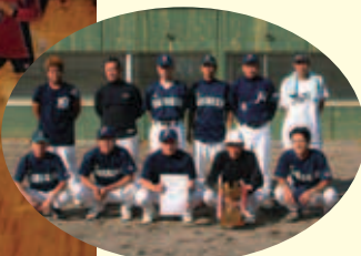
優勝 バットドランカー