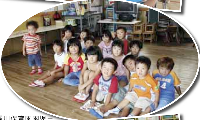
—小成川保育園園児—