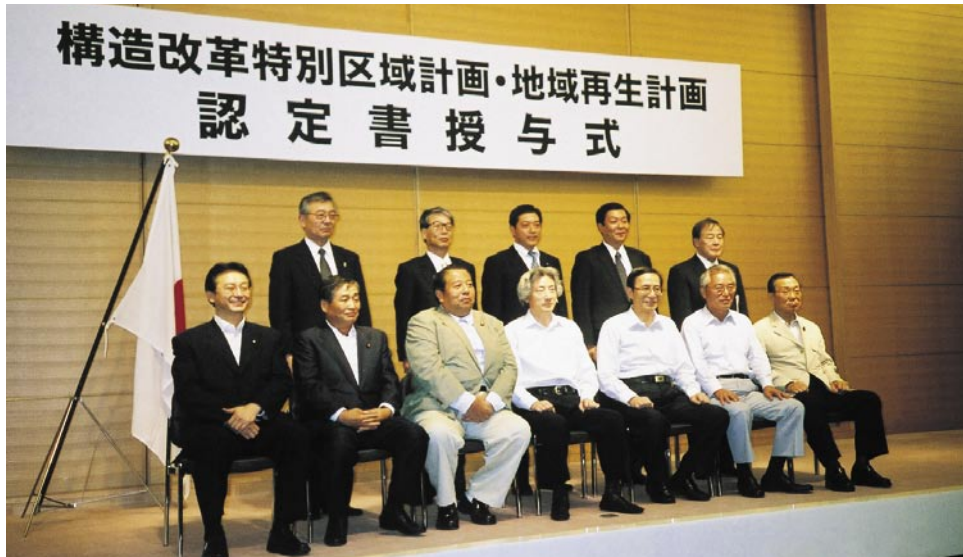
7/19 東京憲政記念館にて、小泉首相を囲んでの認定書授与式に出席。