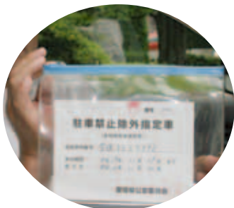
これが駐車許可証です

を利用できるためにも、車椅子標示のある駐車スペースには、介護者がいる場合や一般の駐車場でも利用可能な方は、真に必要な方のため譲り合いをしましょう。障害者の方が運転又は同乗している（公安委員会発行の駐車許可証及びステッカーを貼っている）車の横に駐車する場合は、当事者の方が乗降するための十分なスペースをとりましょう。また、障害者の方も車のよく見える部分に公安委員会発行の駐車許可証及びステッカーを貼りましょう。そして、お互いの譲り合いの中から、誰もが安心して生活できる環境をつくっていきましょう。