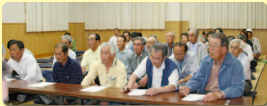
—御荘菊川地区での理事者他との懇談会から—