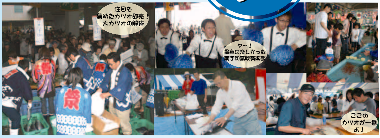
注目を集めたカツオ即売！大カツオの解体

会、愛南町魚食研究会、おつとろっしや産直市協同組合、城辺青果出荷組合など多くの団体が参加しました。「おまつり広場」では、魚のつかみ取りもあり、大きな魚を捕まえるたびに歓声が上がっていました。 当日は、朝から雨が降り、入場者数が心配されましたが、多くの大漁旗で飾られた会場は、親子連れで賑わい、カツオのタタキや刺し身、ごはんの上にカツオやネギをのせたおいしいそうな「カツオめし」、その他野菜に果物、焼きそば等、食べて、触れて、雨を吹き飛ばした活気あるイベントになりました。来年は、皆さんも、おいしいカツオを食べに来て下さい。愛・カツオは深浦ですよ!