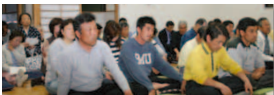
町内で最初に実施された網代地区での地区懇談会