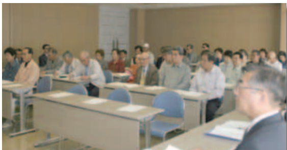
お互いの立場を理解し、支え合う町をめざして －愛南町身体障害者福祉協議会総会(5月12日)－