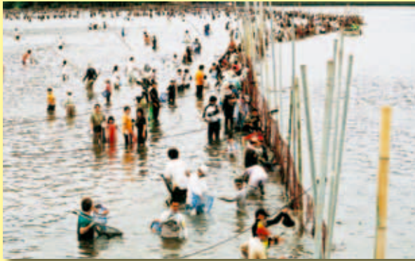
御荘湾立て干し網