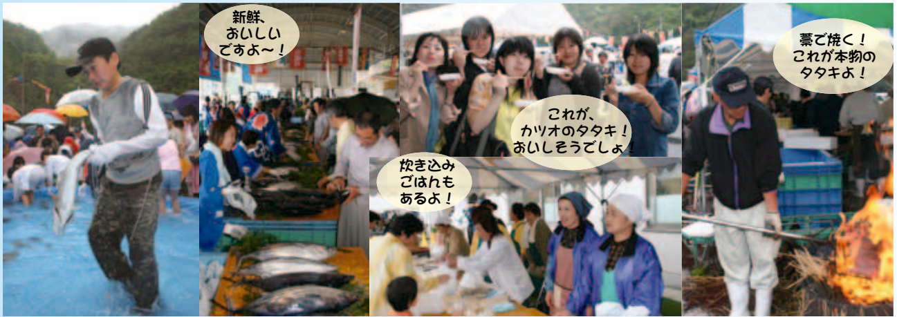
新鮮、おいしいてあよ~!