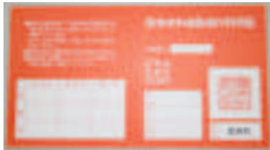
西海有料道路通行利用証