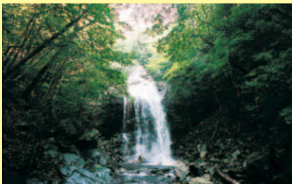
うちくら 内倉 さとる 了さん（西宮市）が撮影した紅ヶ滝（篠山）