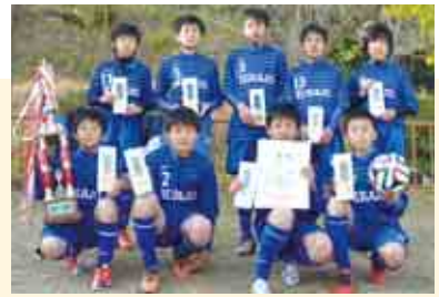
1部A優勝 平城 SC U-12