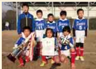
2部優勝 城辺少年サッカークラブB