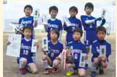
3部優勝 一本松少年サッカークラブ I