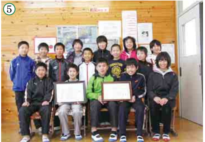
柏小学校 5、6年生の皆さん