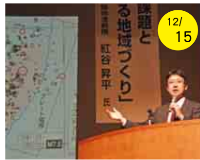
概要は、「広報あいなん1月号（Vol.112）」に掲載しています。