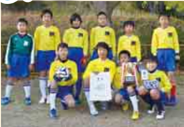
1部B優勝 緑・僧都スポーツ少年団