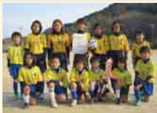
1部B優勝 菊川スポーツ少年団