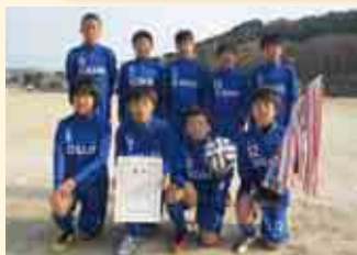
1部A優勝 平城サッカースクールU-12

1部A(6年生以下) 優勝 平城サッカースクールU-12 準優勝 城辺少年サッカークラブB 1部B(6年生以下) 優勝 菊川スポーツ少年団 準優勝 中浦・長月スポーツ少年団 2部(4年生以下) 優勝 城辺少年サッカークラブB 準優勝 平城サッカースクールU-10 3部(2年生以下) 優勝 一本松少年サッカークラブI 準優勝 城辺少年サッカークラブA