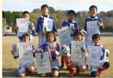
2部優勝 城辺少年サッカークラブ A