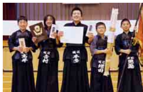
団体戦高学年の部優勝 城辺子供剣道会A