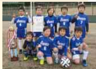
3部優勝 一本松少年サッカークラブI