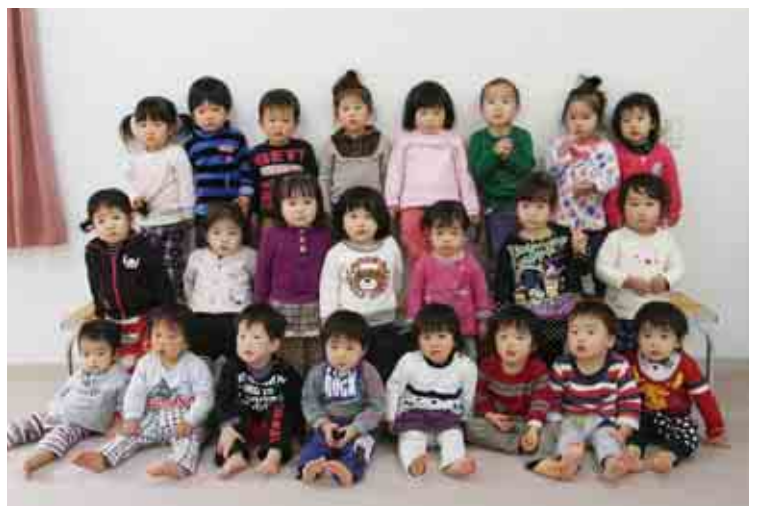
はまゆう乳幼児保育所

問合せ プラザじょうへん内 TEL73-2288 ※ 詳しくは「こぶた通信」に記載