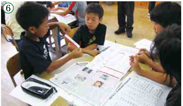
防災に関する研究授業に取り組む児童