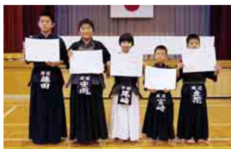
個人戦の優勝、準優勝者