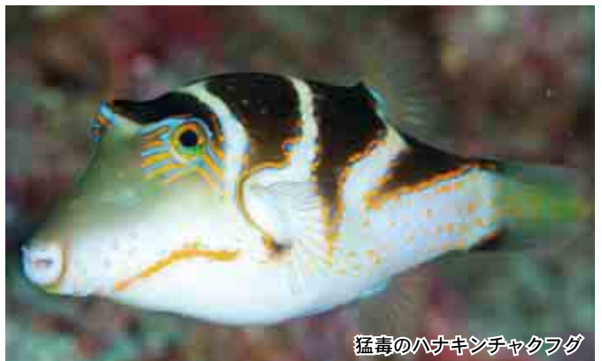
猛毒のハナキンチャクフグ

2月9日はフグの日なので、色彩が美しく、観賞用としても人気のあるハナキンチャクフグの紹介をしたい。