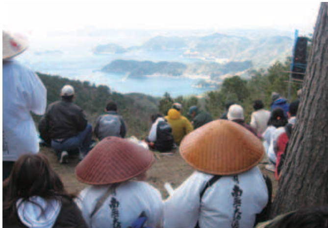
3/11 ▲美しい由良半島をバックに (つわな奥からの眺望)