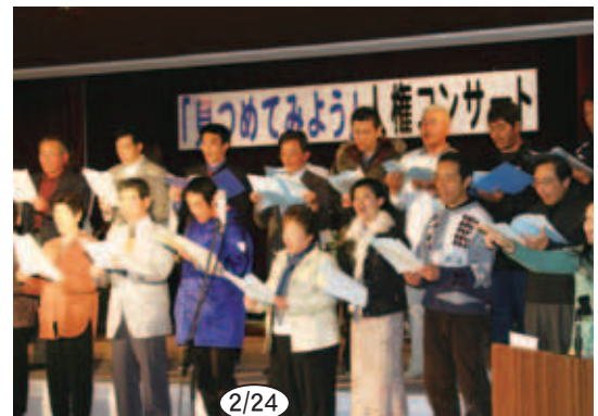
2/24 ▲「見つめてみよう」人権コンサートに 参加した一本松中音楽部、一本松シ ンガーズの皆さん