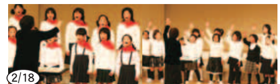
2/18 ▲愛南コーラスフェスティバルで熱唱された児童の皆さん