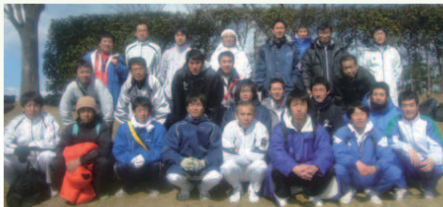
愛南体協陸上部の皆さん