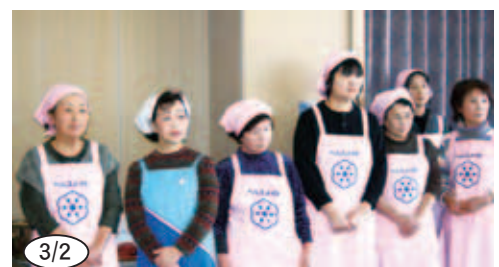
3/2 ▲「あいなん食改味まつり」を主催されたヘルスメイトの 皆さん