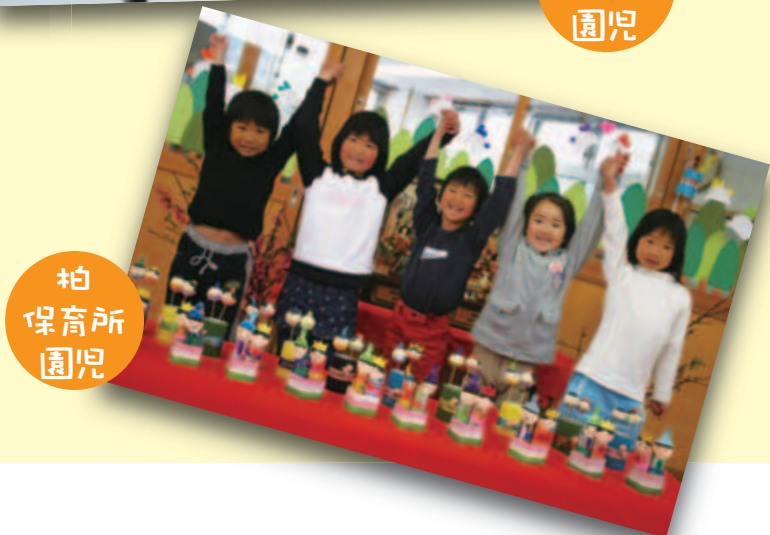
柏 保育所 園児