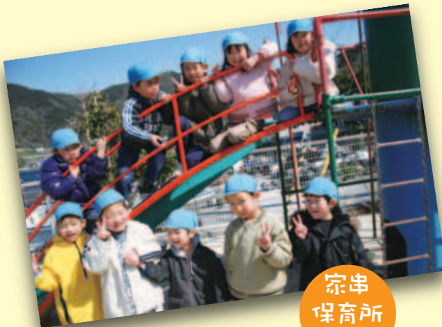
宗串 保育所 園児