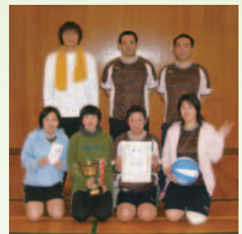
2部優勝 フィフティーズ