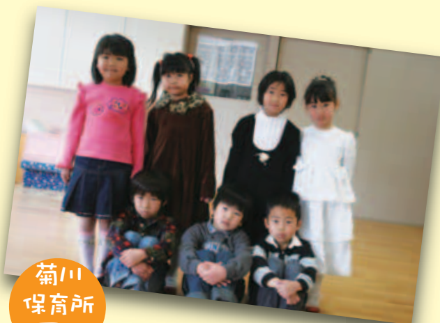
菊川 保育所 園児