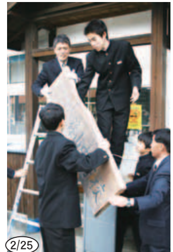
2/25 ▲名残惜しい旧篠山中学校校舎に掛かる 校名(木製看板)を取り外す在校生