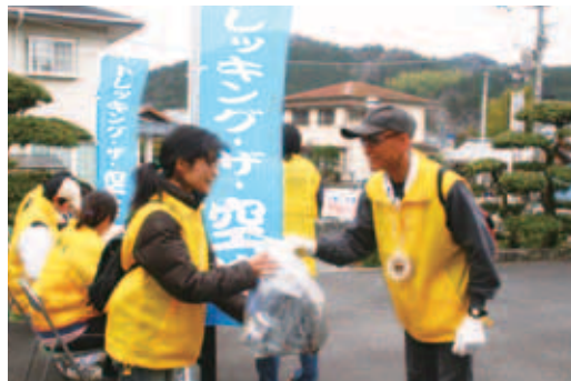
3/10 ◀「松尾坂コース」で、回収したゴミを スタッフに手渡す参加者