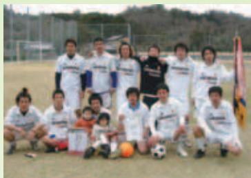
1部優勝 ファミリー

【試合の結果は、以下のとおりです】 1部優勝 ファミリー 2部優勝 キング 3部優勝 JAM 4部優勝 緑OB