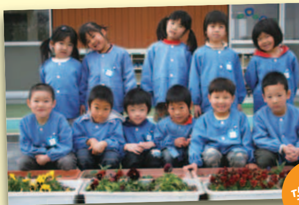
長崎 保育所 園児