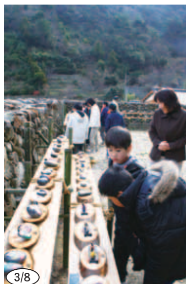
3/8 ▲出品作品を見学する船越小3、4年生 (外泊地区「だんだん雛まつり」)