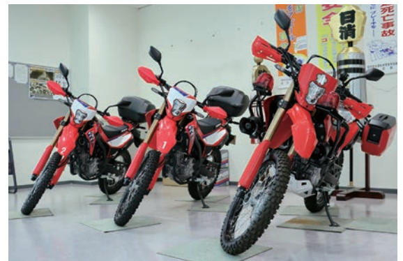
▲写真手前が総務省消防庁より無償貸付された車両

この車両は、消防団の実践的な教育訓練を通じて災害対応能力の強化を目的としており、その一環として救助用資機材等を搭載しています。今回初めて、オフロードバイクが貸付され、狭隘な道路や悪路でも通行できる機動性の高さが期待できます。また、町でも2台のオフロードバイクを購入しており、今後発生が危惧される大規模災害等に備えて、日々の訓練に活用します。