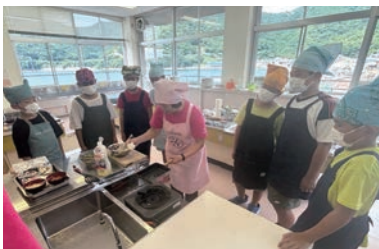
家串小学校 テーマ「バランスのよい朝食・塩分について」

町内の小学校・中学校・高校で子どもの食育教室を実施しています。「食生活の大切さを知り、食に関する興味や関心を持ち、実践することができる」を目的として、町の栄養士、食生活改善推進員等が講師となり、さまざまな食育活動に1年を通して取り組んでいます。