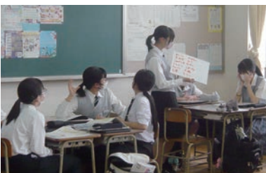
南宇和高校 テーマ「朝食・バランス・塩分について」