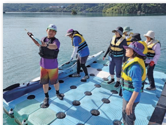
▲さわやか健康づくり教室(マリンスポーツ)

着任3年目の集大成を迎える今年、この研修で身に付けた知識と経験を生かし、更に現場での指導経験を積み重ね、地域に貢献できるスポーツ指導者を目指して何事にも積極的に取り組んでいきます。