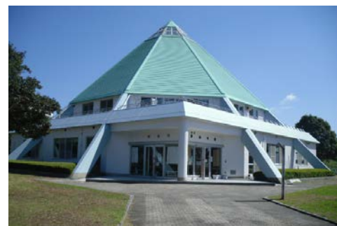
▲御荘夢創造館 (愛南町御荘平城1911番地)