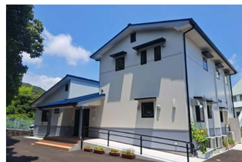
▲子どもの居場所 b&gあいなん (愛南町御荘平城1928番地)