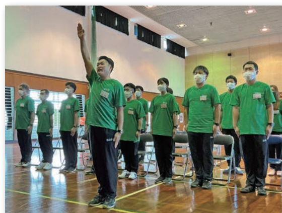
▲研修生代表誓いの言葉(B&G 鹿児島養成研修)