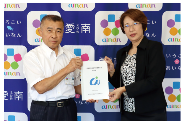
▲左から清水町長、増田委員長