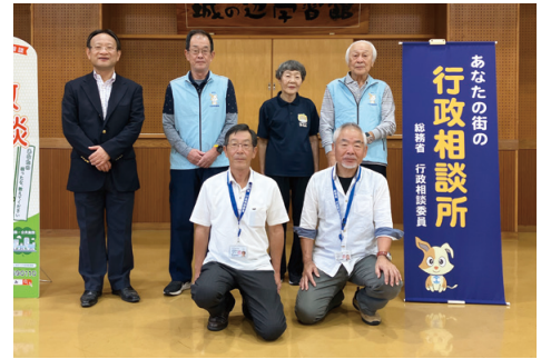
▲各地域の行政相談委員の皆さん