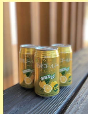
▲愛南ゴールドのチューハイ 内容量：350ミリリットル