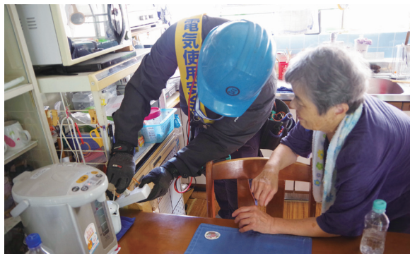
▲組合員から正しい配線方法のアドバイスを受ける

南宇和電気工事組合・(一財)四国電気保安協会・四国電力送配電(株)の3団体が西海地区に暮らす高齢者宅11軒を訪問し、配線状況の確認と安全性の向上につながる配線方法について組合員がアドバイスしました。