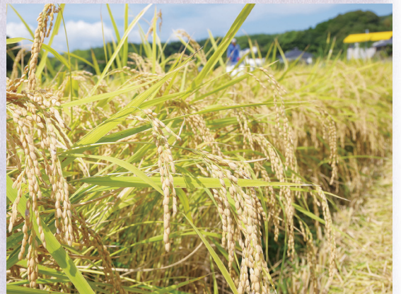
▲天候に恵まれ一粒一粒が立派な仕上がり