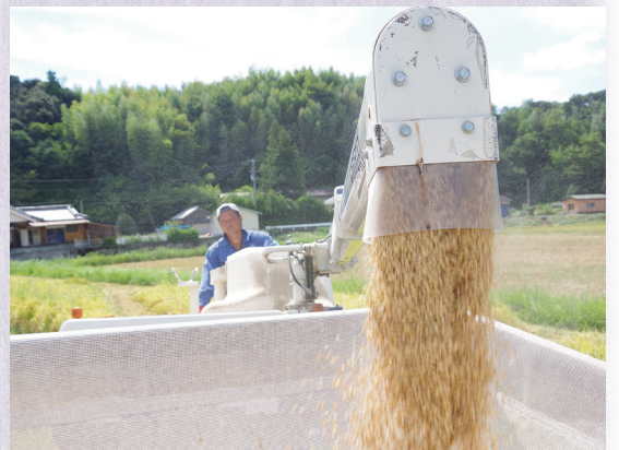
▲コンバインから排出される籾 軽トラで倉庫に運搬し乾燥機に投入します