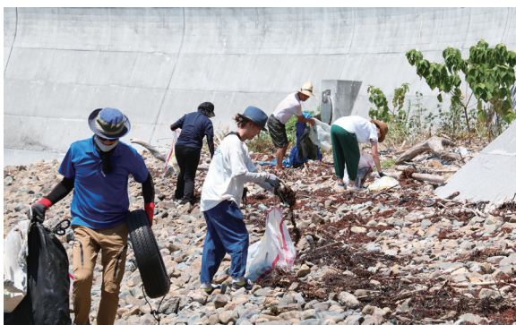
▲町外からもビーチクリーン参加者が集まった

近年の深刻な海ごみ問題について一緒に考え、楽しみながらビーチクリーン活動を行おうと、グリーンパーク須ノ川で『地球と音のカーニバルin愛南』が行われました。