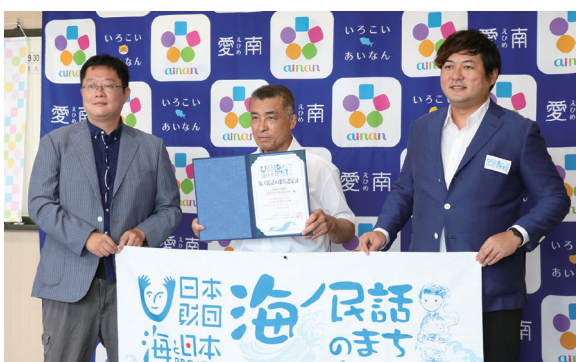
▲左から 芝田事業プロデューサー、清水町長、沼田選定委員長

日本に残された海にまつわる民話を発掘し、物語に込められた「思い」「警鐘」「教訓」をアニメーションとして映像化することで、子どもたちに語り継ぐことを目的に行われている「海ノ民話のまちプロジェクト」に内海地域の民話「大猿島と小猿島」が選ばれました。