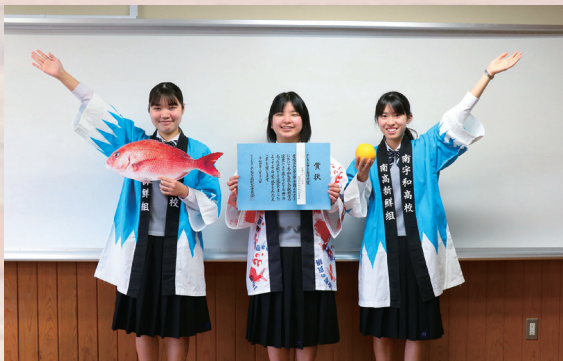
▲他校とは違うプレゼンや伝わりやすいスピーチを行った地域振興研究部の皆さん

3月18日(金)に「エシカル甲子園2021」の本選で、地域振興研究部が、エシカル甲子園特別賞を受賞しました。