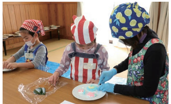
▲花やうさぎなど色鮮やかな花もちを作る参加者

参加者たちは食紅で色付けされた生地で好きな模様や花などの飾りを作り、色とりどりの花もちを作り上げました。また、オレンジピールを混ぜ込んだチョコランチバー かんきつ も製作し、友だちや親子で楽しみながら郷土料理や柑橘についての知識を深めました。