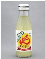
【別府市】 別府ざぼんサイダー