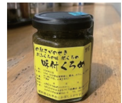
【大分市】 味付くろめ