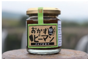
【豊後大野市】 おかずピーマン