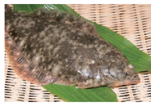
【日出町】 城下かれい