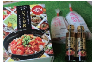
【津久見市】 おうちでひゅうが丼セット