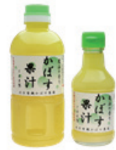
【臼杵市】 かぼす果汁100%