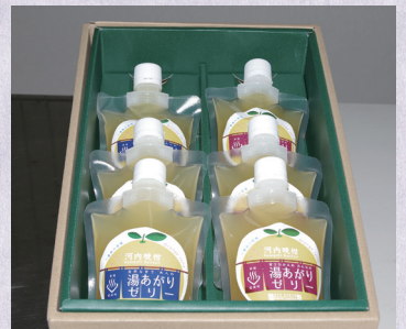
▲湯あがりゼリーは、女性をターゲットにパッケージデザインにもこだわっています。