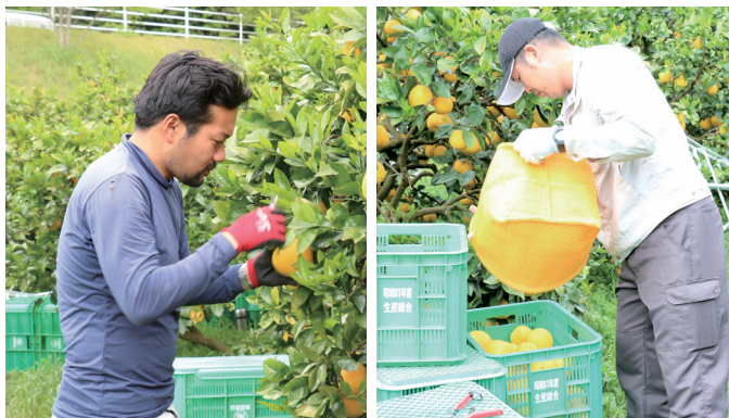
▲研修生が河内晩柑を収穫する様子

JA えひめ南の担い手育成を目的とした農業研修が始まりました。今年度から研修に参加する3人が加わり、主に愛南ゴールド(品種名:河内晩柑)の収穫作業などに取り組んでいきます。