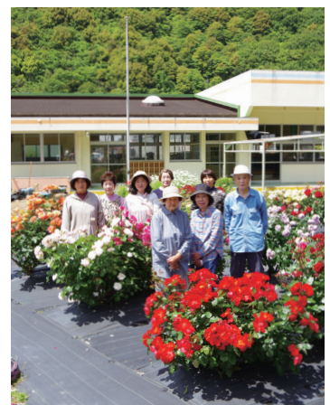
▲バラを育てる東海婦人学級の皆さん