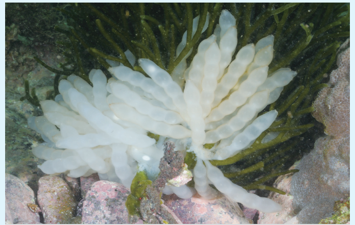
【アオリイカ(モイカ)の卵囊】

愛南町ではモイカと呼ばれているが、これは産卵のために藻場に集まり、しばらくそこで過ごすことに由来している。漢字で書くと藻イカとなる。