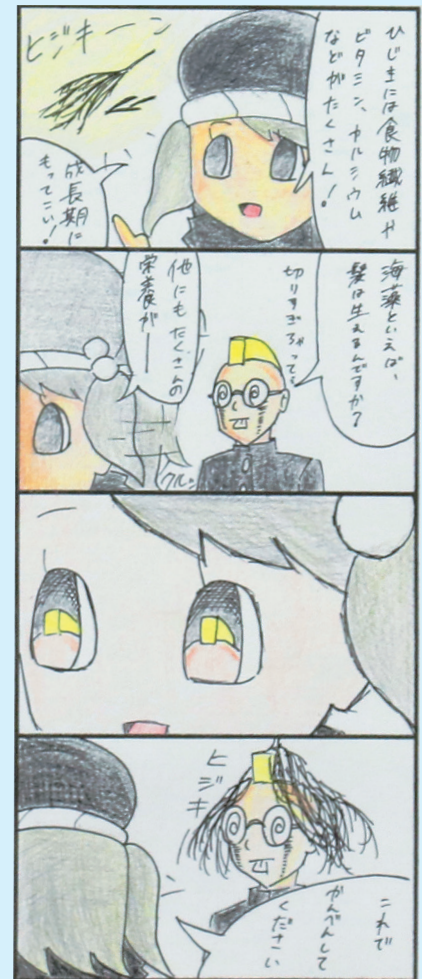
制作：南宇和高校美術 大森 柊芽さん・井上 空さん