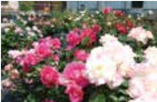
▲丹精込めて育てたバラ