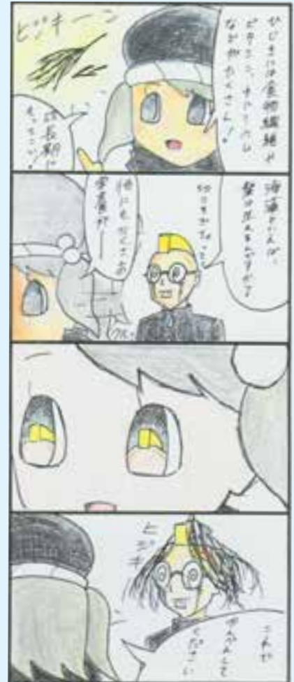
制作：南宇和高校美術 大森 柊芽さん・井上 空さん