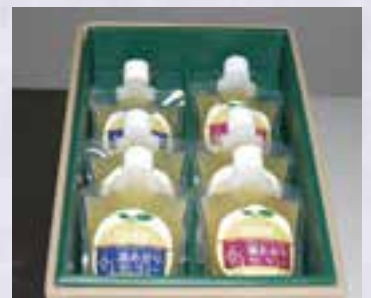
▲湯あがりゼリーは、女性をターゲットにパッケージデザインにもこだわっています。