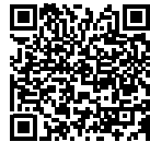
愛南町 ホームページ

現在、児童手当を受給されている方には、個別に現況届の通知を郵送しますので、必ず、6月30日(水)までに保健福祉課または各支所で手続きをお願いします。