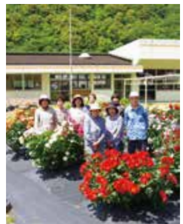
▲バラを育てる東海婦人学級の皆さん