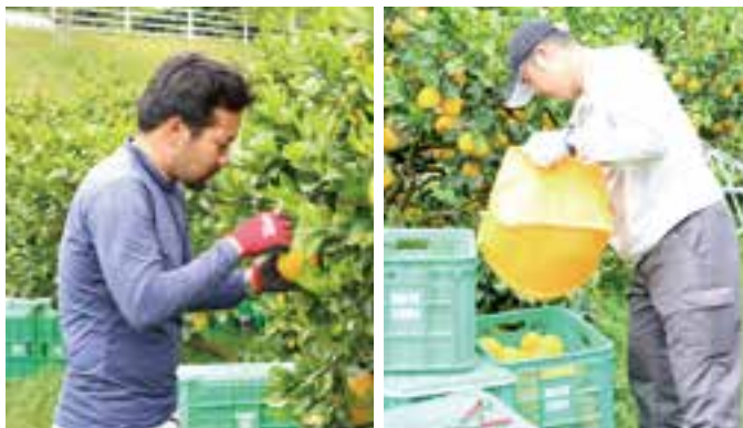
▲研修生が河内晩柑を収穫する様子

JA えひめ南の担い手育成を目的とした農業研修が始まりました。今年度から研修に参加する3人が加わり、主に愛南ゴールド(品種名:河内晩柑)の収穫作業などに取り組んでいきます。