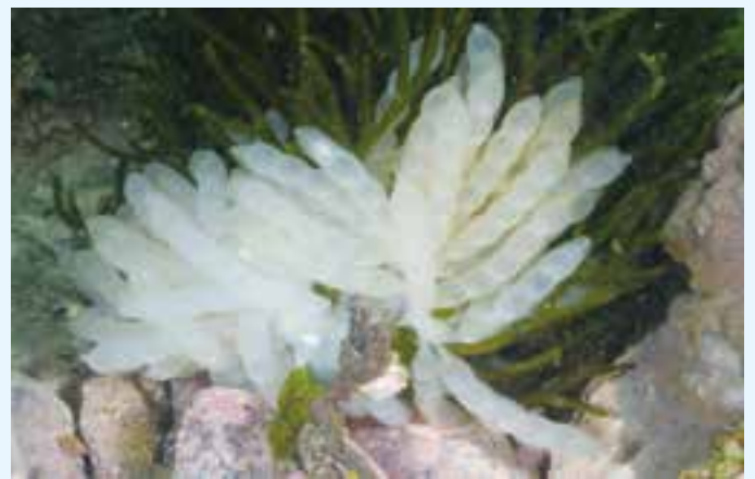
【アオリイカ(モイカ)の卵囊】

愛南町ではモイカと呼ばれているが、これは産卵のために藻場に集まり、しばらくそこで過ごすことに由来している。漢字で書くと藻イカとなる。