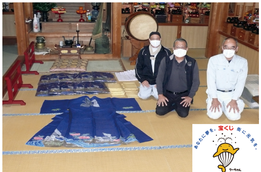
▲「コミュニティ助成事業」の補助を受けて衣装を新調した増田地区のはなとりおどり保存会の皆さん

コミュニティ助成事業は、町が認めたコミュニティ活動(祭り用具の準備等)に必要な備品購入や修繕等に対して助成を行うものです。申請手続きなど、詳しくは総務課にお問い合わせください。