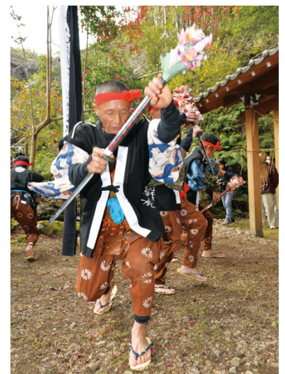
▲正木権現堂前で行われた「正木の花とり踊り」。踊り子9人が400年以上続くと言われる伝統の舞いを披露しました。(12月2日(水)撮影)