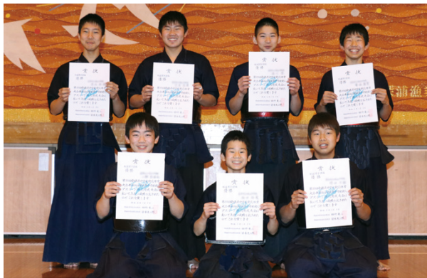
▲優勝した男子剣道部の皆さん

「第33回愛媛県中学校新人体育大会」が愛媛県内の各会場で行われ、町内5校の中学生が参加し、熱戦を繰り広げました。