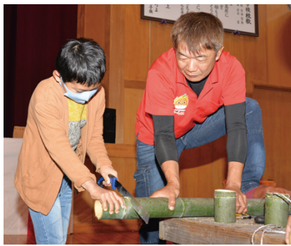
▲「竹馬作り体験」で竹の切り方を教える愛南グリーン・ツーリズム推進協議会の会員(右)

日常生活の中で体験する機会が少ない活動を通じて子どもたちに達成感や感動を得てもらい、豊かな心や郷土愛を育ててもらおうと、旧満倉小学校屋内運動場で「G.T秋の子ども大収穫祭〜全員集合!〜」(愛南グリーン・ツーリズム推進協議会主催)が行われました。 昨年が続いて2回目の開催となったこの日は、地元の園児から大人まで約60人が参加し、御荘湾で養殖された真珠を用いてストラップなどのアクセサリを作る体験や、のこぎりや竹を切ったひも付きの竹馬を作る体験、松ぼっくりや魚のうろこを材料にしたクリスマスリース作