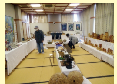
▲センター2階の様子