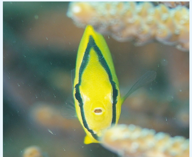
【トノサマダイ（殿様鯛）】

名前にタイと付いているが、実はチョウチョウオの仲間だ。「腐っても鯛」と言われるように、日本人が大好きなタイが付いた、いわゆる「あやかりタイ」の一種である。