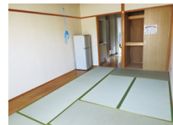
▲和室の状況 (洋室もあります)

▶入居条件 60歳以上で、身の回りのことは自分でできるが自炊ができない程度の身体能力の低下が見られる方や、独立して生活するには不安のある方