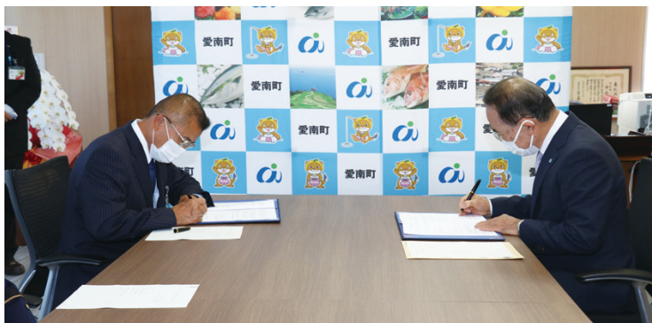
▲協定書に署名をする清水町長(左)と住田副社長

住田副社長は、「災害がないことが一番良いことだが、有事の際は、愛南工場を活用していただきたい」と話しました。