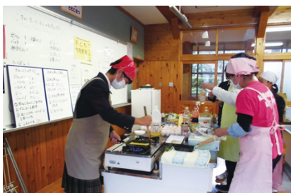
【子どもの食育教室】

食生活改善推進協議会員が放課後児童クラブで、手作りの教材を使用して「かむことの大切さ」を伝えたり、中学生へ今後の独り立ちに役立ててもらったりするために調理実習を行いました。