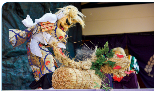
国指定重要無形民俗文化財の御嶽神楽。 力強く華麗で勇壮な舞が特徴。

鋭く尖った稜線や岩壁など荒々しい姿を持つ祖母山は、地域の人々の畏敬の念を集めてきました。