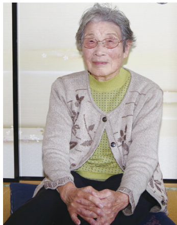
※名前は、川柳名です。