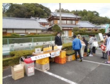
▲南宇和高校農業科の販売