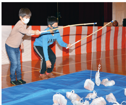
▲ナスやタマネギ、ブロッコリーなど愛南町産の野菜が入った袋を釣り上げる「野菜釣り体験」