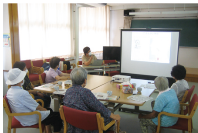
【公民館事業（高齢者学級）】