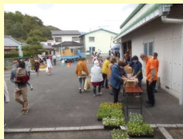
▲センター前のバザーの様子