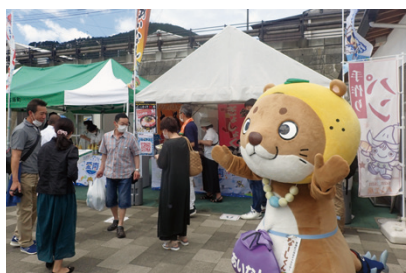
【道の駅 天空の郷さんさん】