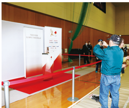
▲聖火が灯ったランタンを撮影する来場者

会場内では、新型コロナウイルス感染拡大防止対策が施され、会場の外では、オリンピックトーチの展示などがあり、来場者は楽しんでいました。