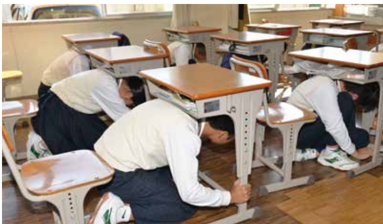
机の下に身を隠す生徒