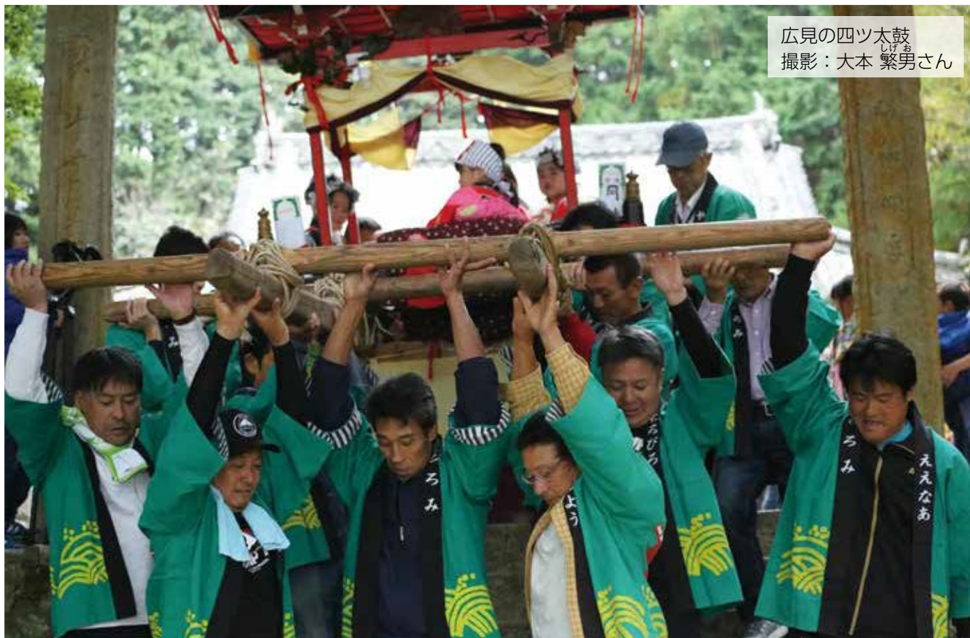
広見の四ツ太鼓