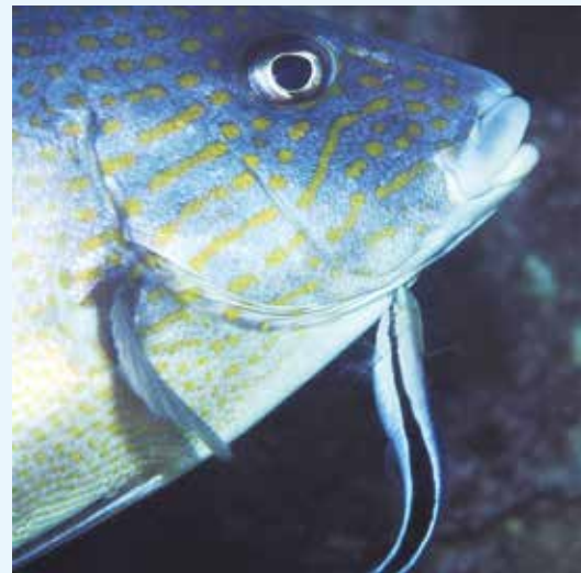
【掃除中のホンソメワケベラ】