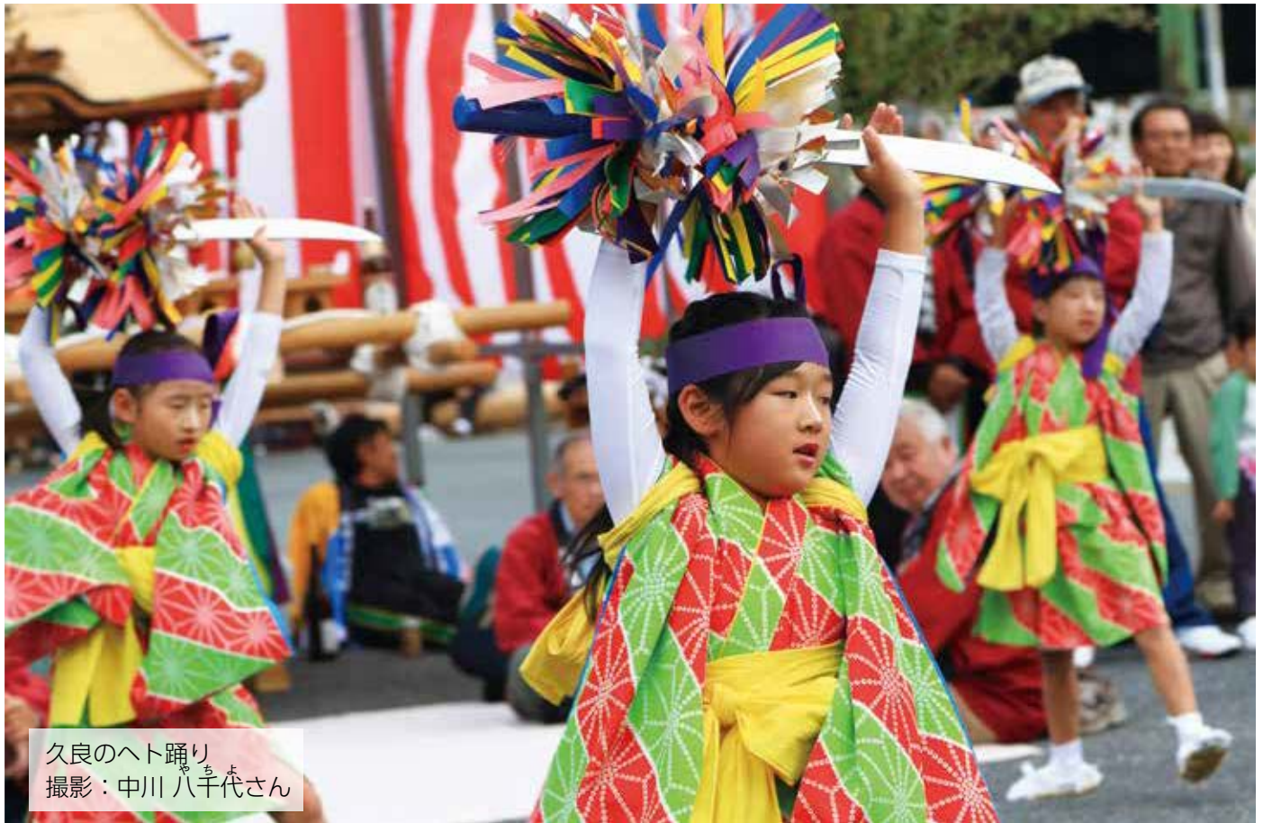
久良のへト踊り