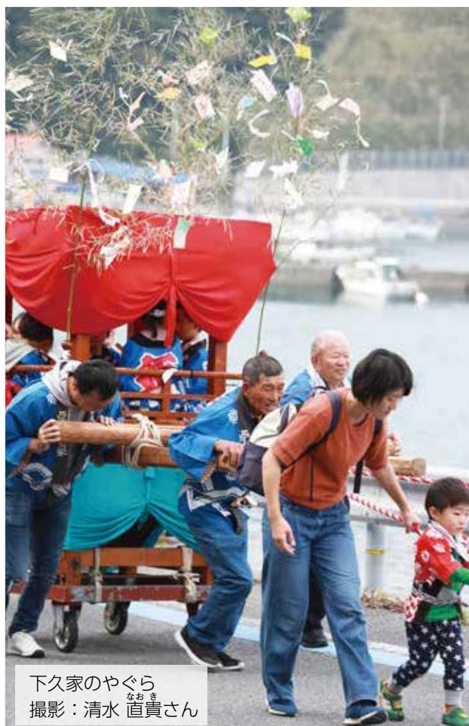
下久家のやぐら