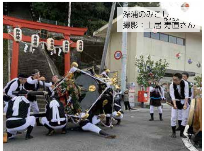
深浦のみこし