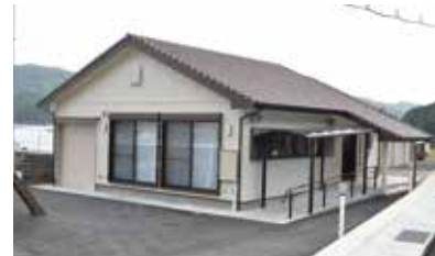
落成した下久家集会所

老朽化に伴う新築工事を進めていた下久家集会所(木造平屋建)が9月30日(月)に完成し、落成を祝う地域住民らが集い餅まきが行われました。