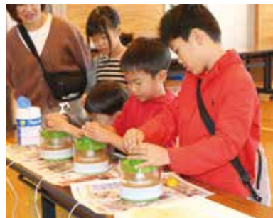
温州ミカン生搾り体験

旧満倉小学校屋内運動場で「GT(グリーン・ツーリズム)秋の子ども大収穫祭～全員集合!!～」(愛南グリーン・ツーリズム推進協議会主催)が開催され、親子連れなど約50人が参加しました。