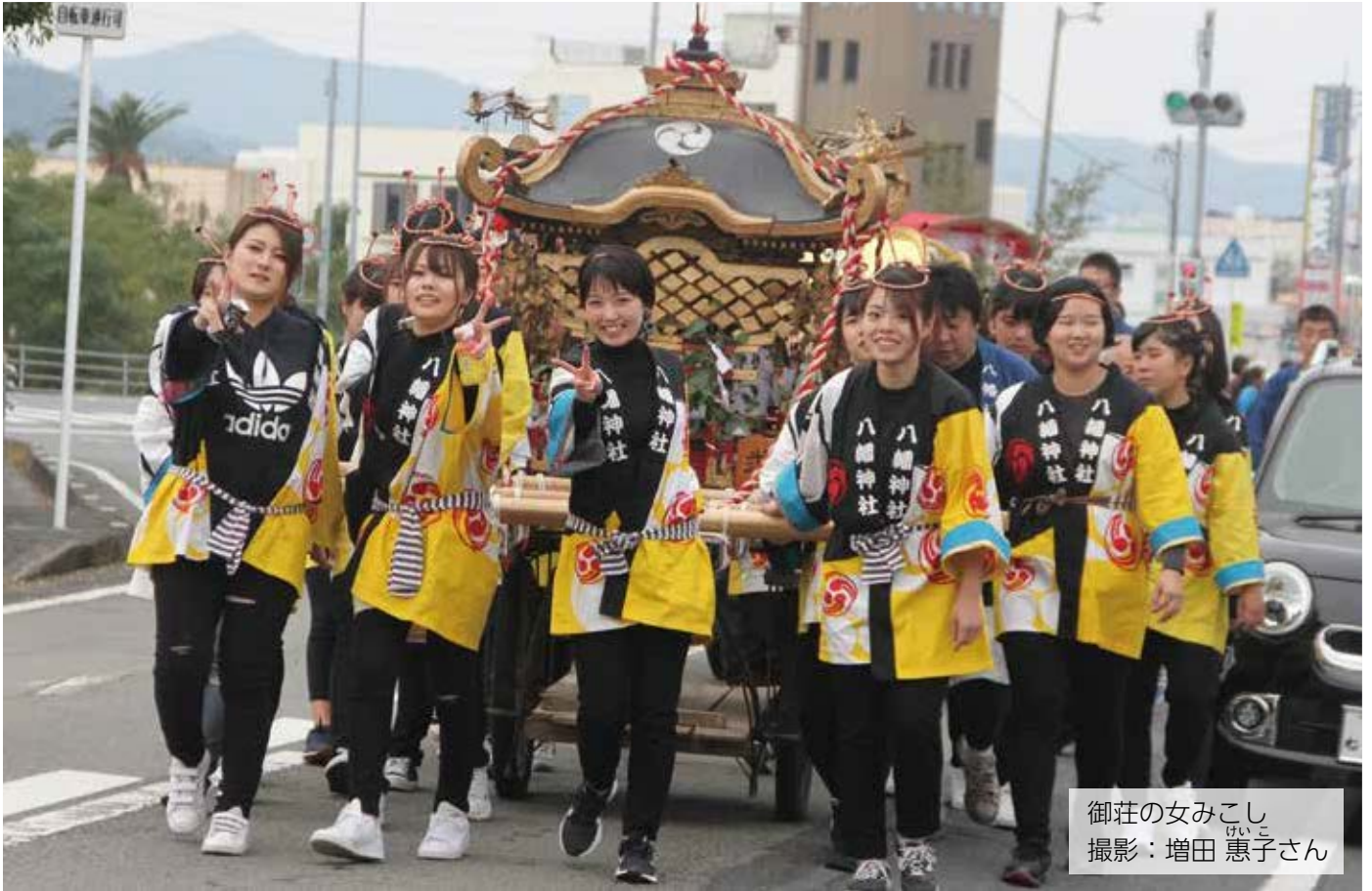
御荘の女みこし