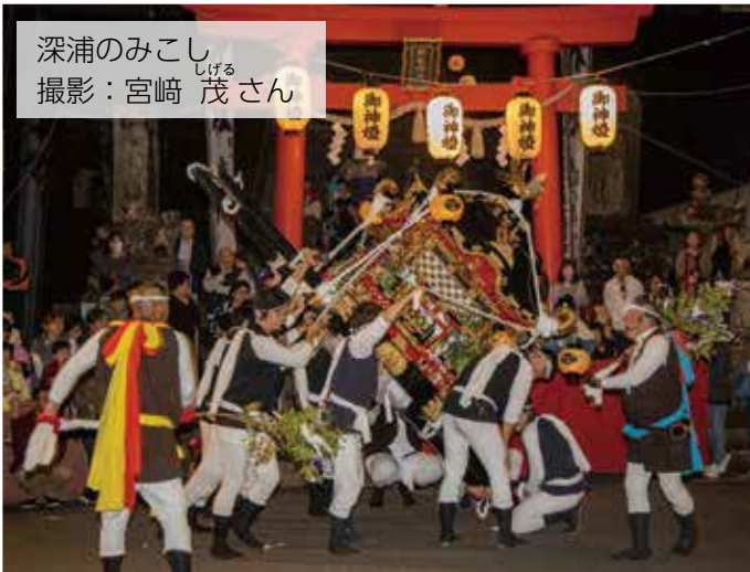
深浦のみこし