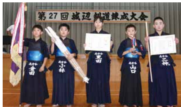
団体戦高学年の部 優勝 南宇和剣道会