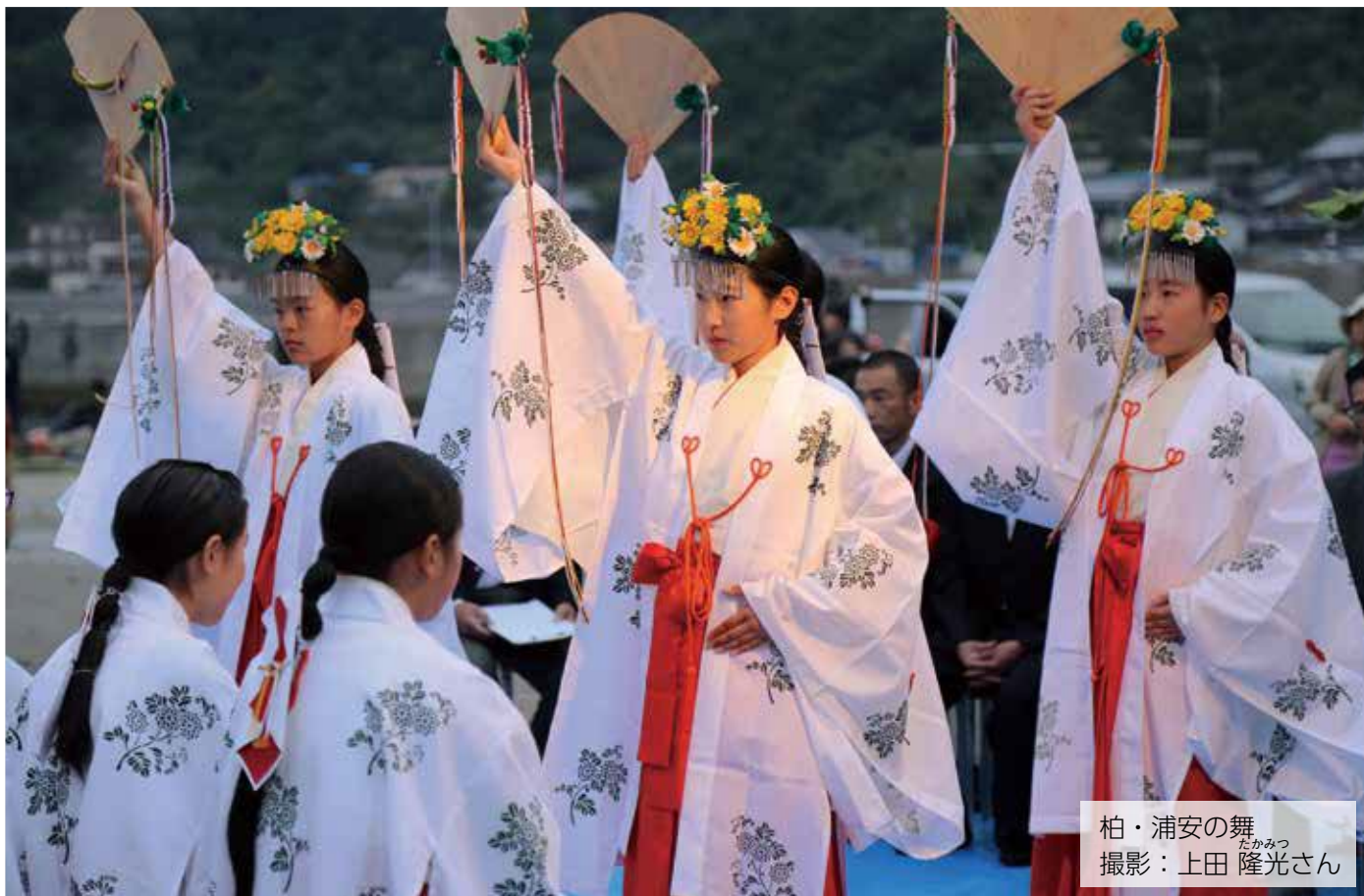
柏・浦安の舞 たかみつ