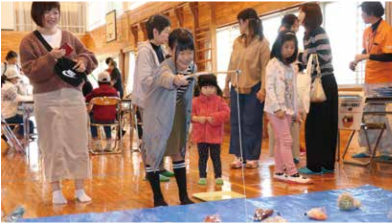
野菜釣り＆重量当て体験