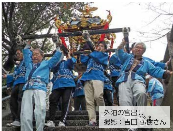
外泊の宮出し