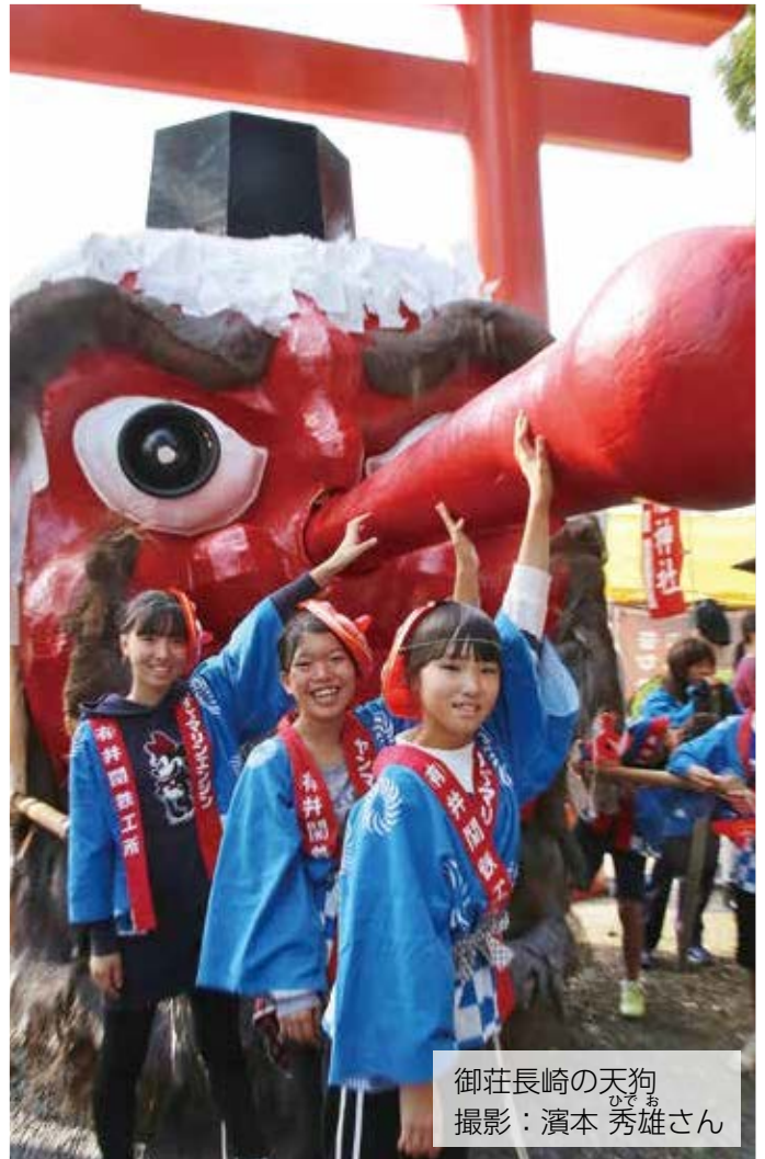
御荘長崎の天狗