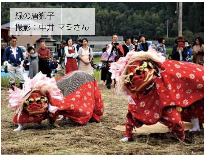
緑の唐獅子