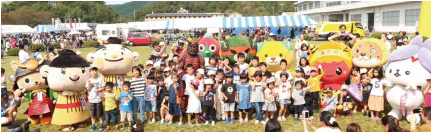
各地域ご当地キャラクターたちと記念撮影

愛南町の秋の味覚を味わってもらうと、「愛南まるゴチ秋の味覚祭」(愛南食のイベント実行委員会主催)がレクザム愛南工場敷地内(広見地区)で開催されました。