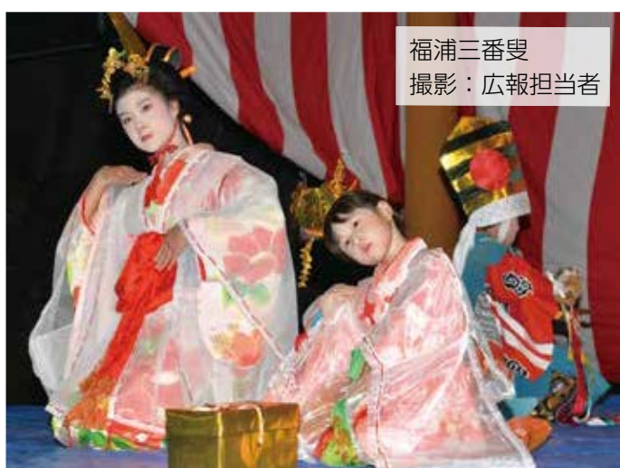
福浦三番叟