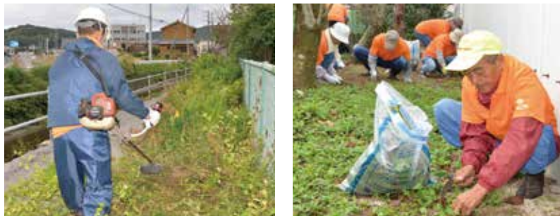
事務所周辺で草刈りや草引きを行う会員

10月の「シルバー人材センター事業普及啓発月間」に合わせて、愛南町シルバー人材センターの会員や職員など19人が、約1時間かけて事務所周辺の除草作業を行いました。