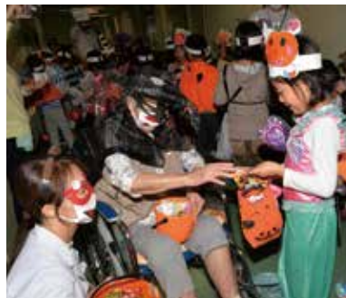
仮装で患者に元気を与える子どもたち

国保一本松病院で「ハロウィンパーティー in 一本松病院」が開催され、職員や入院患者らがハロウィンの衣装に仮装して地元の一本松小学校児童を迎え入れました。