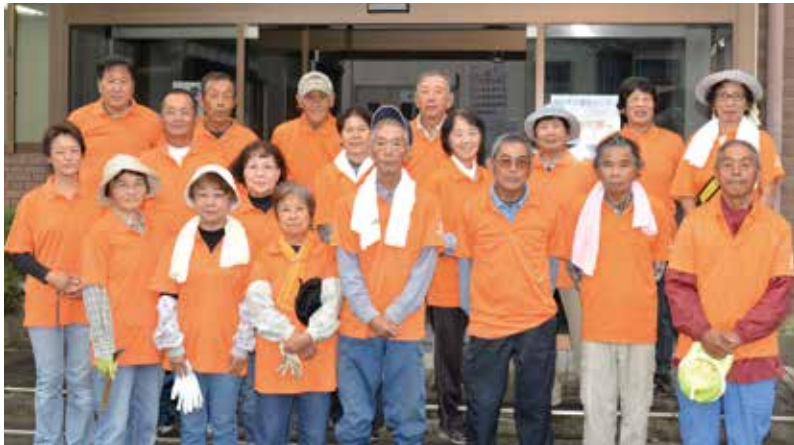
シルバー人材センターの会員や職員の皆さん