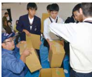
地域住民や消防署の職員と一緒に避難所準備

地震による災害からできるだけ早く避難するための能力や態度を身に付けるとともに、避難所生活への理解を深めることを目的に、城辺中学校体育館で校区内の自主防災会・消防団と城辺中学校の合同による避難訓練が行われました。城辺地域全体でこういった防災訓練が実施されるのは初めてのことです。