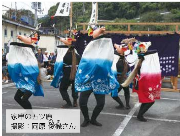
家串の五ツ鹿 としき