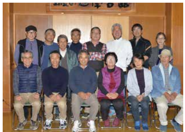
「愛南フォトクラブ」の皆さん

写真展開催やイベントの撮影協力、ケーブルテレビ「びやびや愛南タイム」内の「愛南フォトクラブ30秒」コーナーへの投稿など幅広く活動しています。