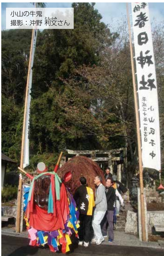
小山の牛鬼 としのみ