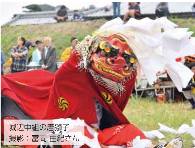
城辺中組の唐獅子