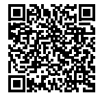
町公式ホームページ (案内ページ)