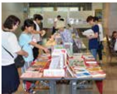
県立図書館の蔵書約1,300冊が並び、貸し出しが行われました