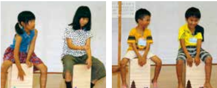
カホンの演奏を楽しむ子どもたち

小学1～3年生対象の夏休み子ども教室「カホンであそぼう」が御荘夢創造館であり、14人が参加しました。