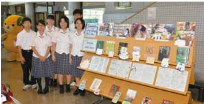
南宇和高校図書委員会の生徒が推薦する本の特別展示も実施

愛媛県立図書館による「おでかけ県立図書館in愛南」が御荘文化センターであり、多くの方が来場しました。