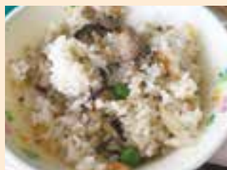
7月のととの日 「かつおごはん」