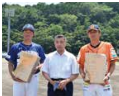
試合前には両チームに記念品が贈呈されました

愛媛マンダリンパイレーツの公式戦(vs.徳島インディゴソックス)が南レク城辺公園野球場であり、400人以上の方が来場してプロ野球選手の迫力あるプレーを観戦しました。