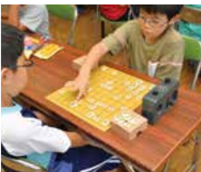
自由対局で交流する参加者の皆さん

暴力団を排除し、明るく住みよい町づくりを推進するため、御荘文化センターで愛南町暴力追放JUMIN大会があり、地域住民など約200人が参加しました。