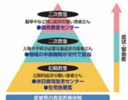
【症状に応じた救急医療機関の役割分担】