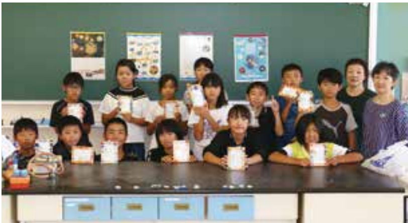
シーボード体験の参加者の皆さん