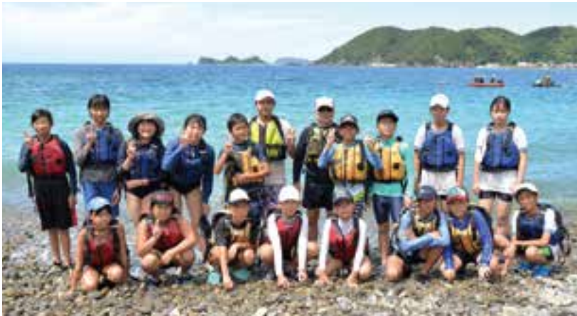
シーカヤック体験の参加者の皆さん