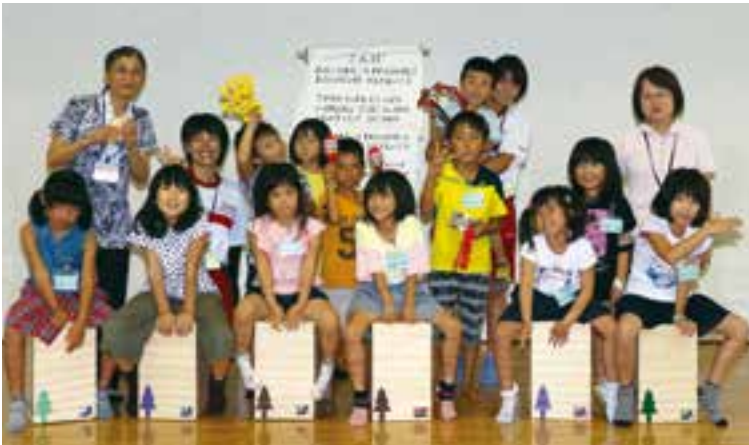
「カホンであそぼう」参加者の皆さん