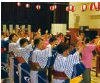
愛南音頭を踊る参加者と入所者の皆さん

城辺中学校 女子ソフトテニス部(個人) 結果：2回戦敗退 日程：8月20日(火)～22日(木) 場所：京都府立山城総合運動公園