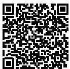
町公式フェイスブック 「ぎゅぎゅっと!愛南」

また、農林業に関する情報を発信する「あいなん農林業ネット」や、愛南町地域おこし協力隊の活動などを発信するフェイスブックも運用していますのでご利用ください。