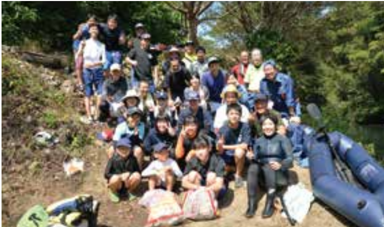
僧都川クリーン作戦の参加者の皆さん