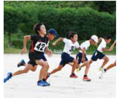
昨年(前回大会)の様子

各種目には参加資格があります。出場を希望される方は、生涯学習課(愛南町スポーツ協会事務局)にお問い合わせください。