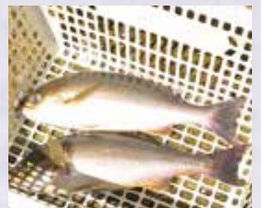
▲脂が乗ったイサキ。魚体は300gほどが中心ですが、中には500gを超えるものも。