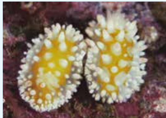
【イガグリウミウシの交接】

実りの秋になり、おいしい食べ物が産直市場に並び始めている。甘くておいしい栗も、これから旬を迎えるようである。