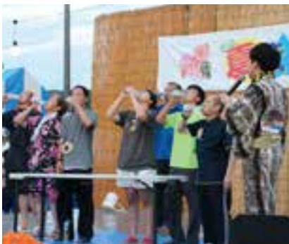
御荘診療所夏まつり恒例のラムネ早飲み競争

清掃後、参加者はカヌーやパックラフトなどの自然体験活動を行い、川遊びを楽しみました。また、この日は地元の消防団も参加し、水難事故防止のための救助訓練を行いました。