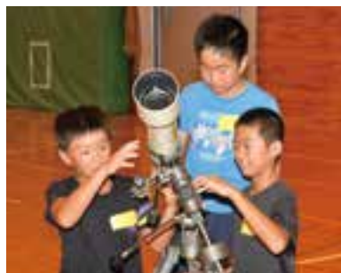
体験を楽しむ子どもたち