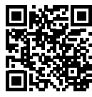
農林業の情報発信 「あいなん農林業 ネット」