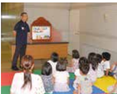
紙芝居の読み聞かせを行う愛媛県立図書館長