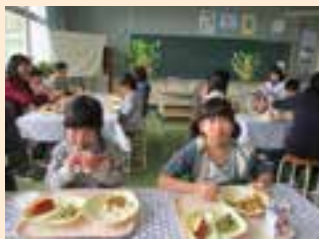
長月小学校の給食の様子

皆さんは、家族そろってゆっくりと食事をする時間はとれていますか？楽しく会話をしながら、五感を使って味わうことを意識して、より有意義な食事の時間にしていきたいですね。