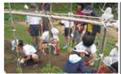
ミレニアム畑での作業

また、お店に行けば簡単に手に入る肉や魚。簡単に手に入るからこそ、忘れがちな生き物たちの元の姿。そして、私たちのために犠牲になってくれたかけがえのない命をいただくということ。長月小学校では、「食」を通して自分が生きるということ、命に感謝することを学んでいます。