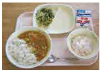
4月の学校給食「愛南新玉ねぎカレー」です!

食育の日には、大きな声で「いただきます」「ごちそうさま」といったり、家族全員そろって楽しく食事をするなど、ご家庭でも少し「食」を意識してみてください。