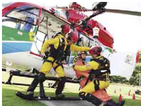
駐機訓練で隊員を回収する 県消防防災航空隊

博隊長は「想定訓練では、無線連絡等で活動に対する連携が円滑にできたと思う。ヘリの特性である音と風を十分理解していただき、ヘリを有効に活用して私たちと共に人命救助にあたっていただきたいと思います」と話しました。