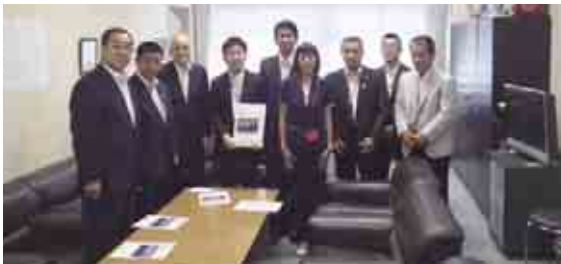
(写真左側から)中西哲参議院議員、井原巧参議院議員、山本公一衆議院議員、石川雄一国土交通省道路局長、中平富宏宿毛市長、山本肖子愛南町PTA連合会長、清水雅文愛南町長、岡崎利久宿毛市議長、宮下一郎愛南町議長