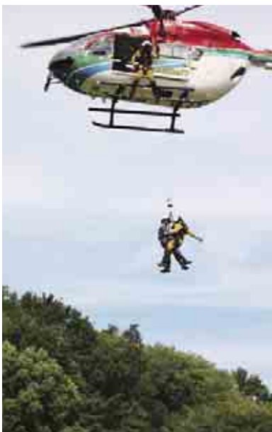
防災ヘリを使った隊員投入訓練