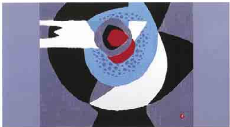
■ホール緞帳「笑顔で育てよう、みんなの御荘」

講演会や式典などで目にする機会が多い御荘文化センターホールの緞帳。インパクトのある絵が特徴ですが、この絵があらわすものや作者についてご存知でしょうか。ホールにお越しの際は、ぜひゆっくりご覧ください。