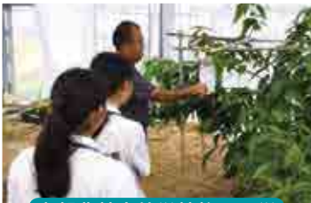
中部農林高等学校施設見学