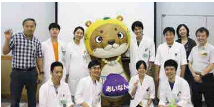
なーしくん登場で研修医も大喜び！