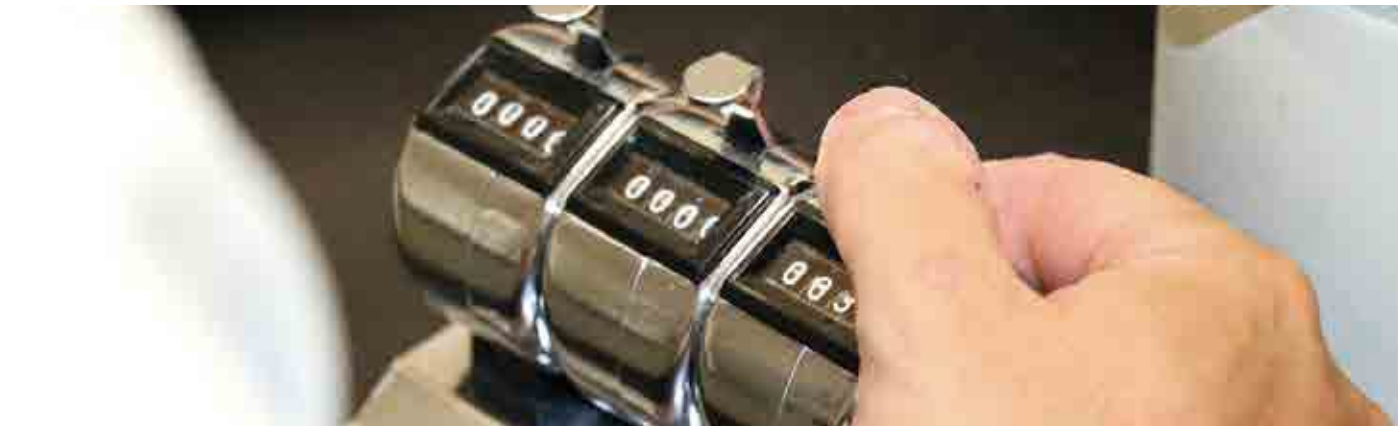
職員は顕微鏡を覗いて無言で有害プランクトンを数えます。その間「魚病診断室」にはカチッカチッカチッカチツという乾いた音が響きます