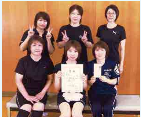
優勝 1部 ヴィアンカ

両日は、ファーストピッチ・ミニソフトボールの試合だけでなく、南レクサンパールプールでの交流、親睦会を開催し、子どもたちのたくさんの笑顔を見ることができた交流会になりました。