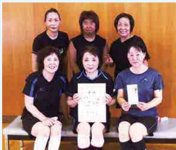
優勝 2部 ワンピース