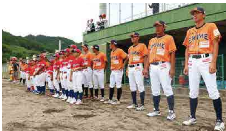
マンダリンパイレーツの選手と並んで試合開始を待つ愛南町少年野球クラブ「レッドファイターズ」の皆さん

試合は5-2でマンダリンパイレーツが逆転勝ち。愛南町で行われる年に1度の公式戦で、この日を心待ちにしていた野球ファンに勝利をプレゼントしました。