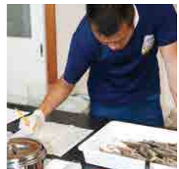
養殖業者から持ち込まれた魚を診断して結果を記入する職員。多い時には日に数百匹の魚が持ち込まれます

魚も人間と同じように病気にかかり、そのまま放っておくと他の魚に移っていきます。魚類養殖の場合、同じいけすに数百尾から数万尾の魚が入っているため、一旦、病気が流行ると大きな被害になりかねません。そこで、病気の流行による被害を未然に防ごうと行われている