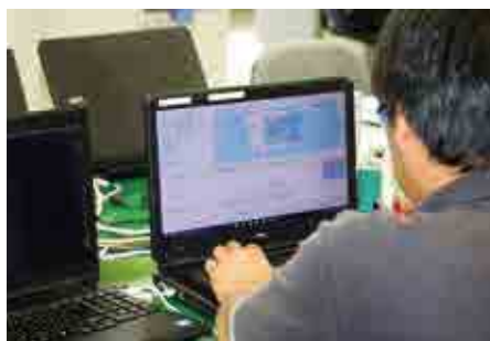
調査結果はシステムに入力後、関係者に一斉にメールで報告されます。画面では、どこでどれくらいの有害プランクトンが発生しているのか、一目で確認できます