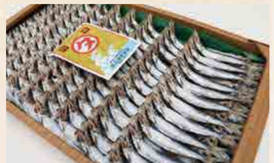
▲塩加減にこだわって作られたウルメイワシの丸干し