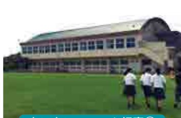
あいあいファーム視察①