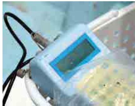
赤潮が発生したときには、海中の植物プランクトンの量を測り、最も多い水深から海水を汲み取って調査します