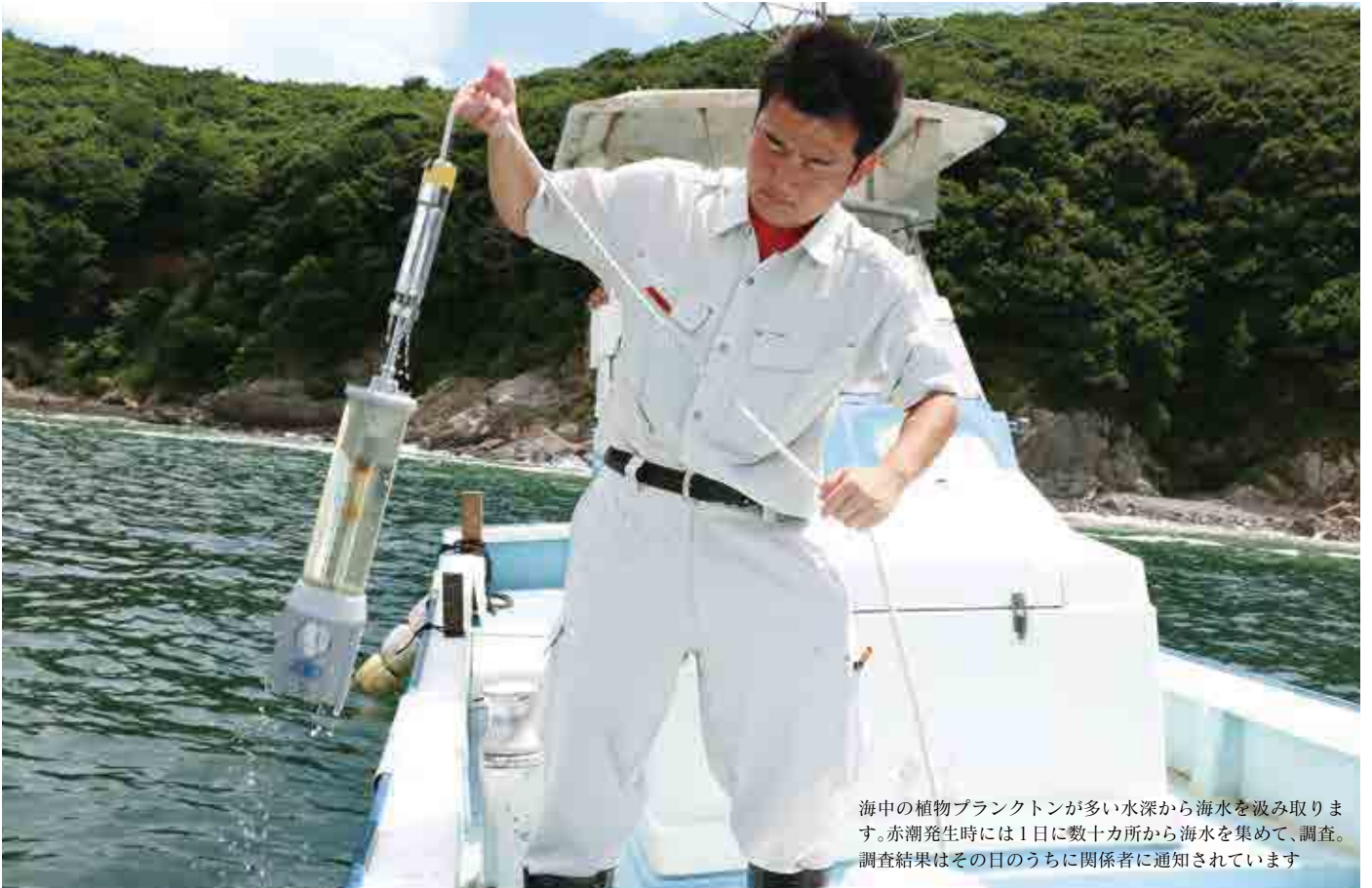
海中の植物プランクトンが多い水深から海水を汲み取ります。赤潮発生時には1日に数十カ所から海水を集めて、調査。調査結果はその日のうちに関係者に通知されています