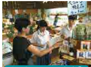
あいあいファーム視察②

7月12日(水)から15日(土)、沖縄県に学校の代表3名が販売実習に行きました。その時の様子を紹介します。