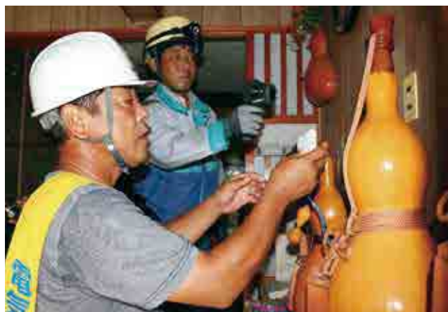
独居高齢者宅を訪問してコンセント周辺の点検を行う南宇和電気工事組合の組合員さん

訪問先では火災の原因になるコンセント周辺のほこりをこまめに取り除くよう注意を呼びかけました。