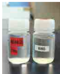
海水のサンプル。赤潮発生時は「魚病診断室」が海水を汲み取ってきて調査を行います