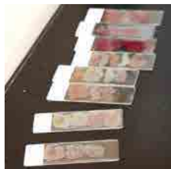
魚のエラと臓器の一部を顕微鏡で観察し、病気の原因である寄生虫や細菌を見つけます

るのが魚病診断です。愛南町の魚病診断を一手に担う「魚病診断室」では、役場水産課の職員と愛南漁協の職員が常駐して、養殖業者から運ばれてくる死魚を解剖し、魚の死因を特定して適切な対処法を記した診断書を発行しています。