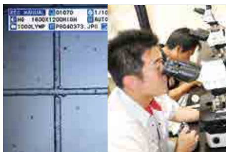
顕微鏡を巧みに操作しながら1mlあたりに含まれる有害プランクトンの数を数える職員