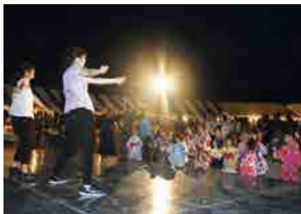
愛媛大学医学部ダンス部のパフォーマンス

御荘平山の御荘診療所敷地内で「御荘診療所夏祭り」が行われました。メインステージでは恒例の浴衣美人 & 甚平美男コンテストや愛媛大学医学部ダンス部のダンスステージが行われ、会場が一体となって盛り上がりました。祭りの最後には打ち上げ花火が上がり、訪れた人を楽しませました。