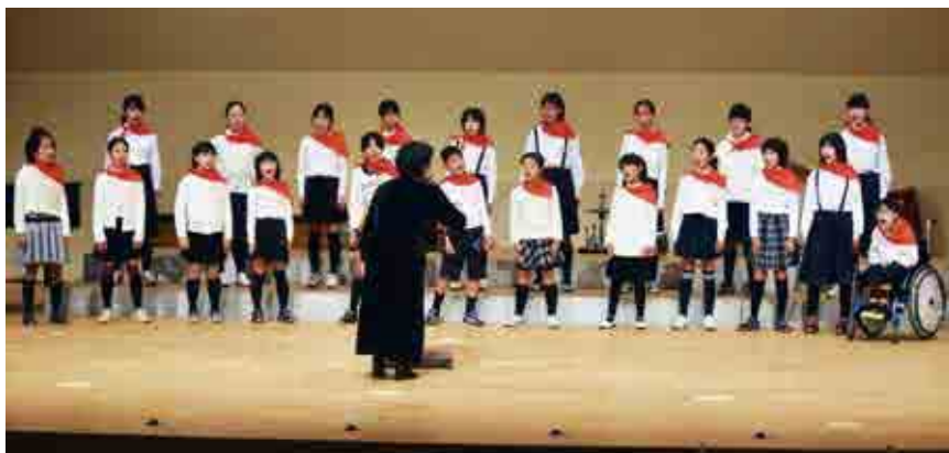
のびやかな歌声を披露する愛南町少年少女合唱団

愛南町文化祭（主催：愛南町文化協会）が御荘文化センターなどで2日間にわたって開催され、文化協会会員の皆さんが、ステージ発表や展示などで1年間の活動の成果を披露しました。「訪れた人に楽しんでもらえるように例年とは展示場所を大きく変えた」（事務局）という会場にはスタンプリヤーも設置され、2日間で約400人が楽しみました。