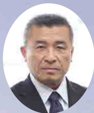
愛南町長 清水 雅文 まさひこ