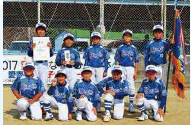
1部優勝 愛南平城ソフトボールクラブ