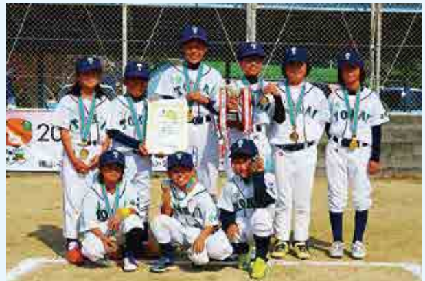
2部優勝 東海スポーツ少年団