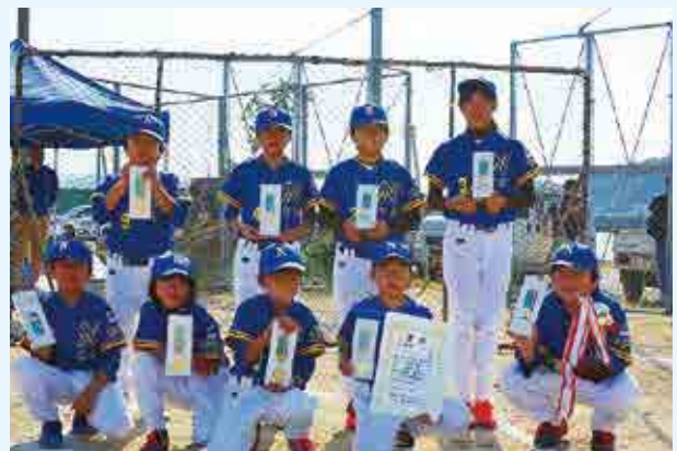
3部優勝 中浦スポーツ少年団