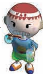
愛南町健康キャラクター げんきくん