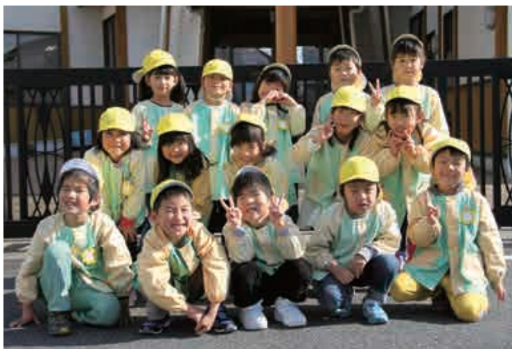
城辺保育所 きりん組