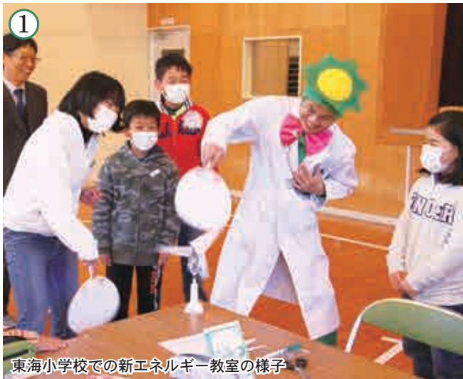
① 東海小学校での新エネルギー教室の様子