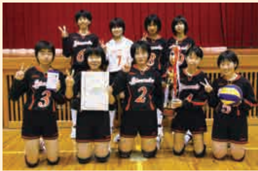
優勝 一本松中学校