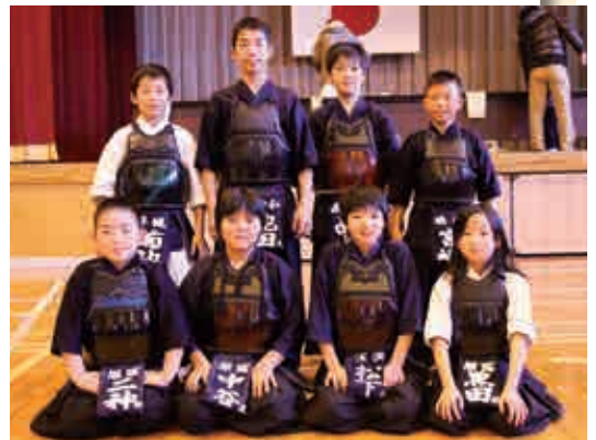
個人戦の優勝、準優勝者