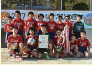
1部A 優勝 城辺少年サッカークラブ