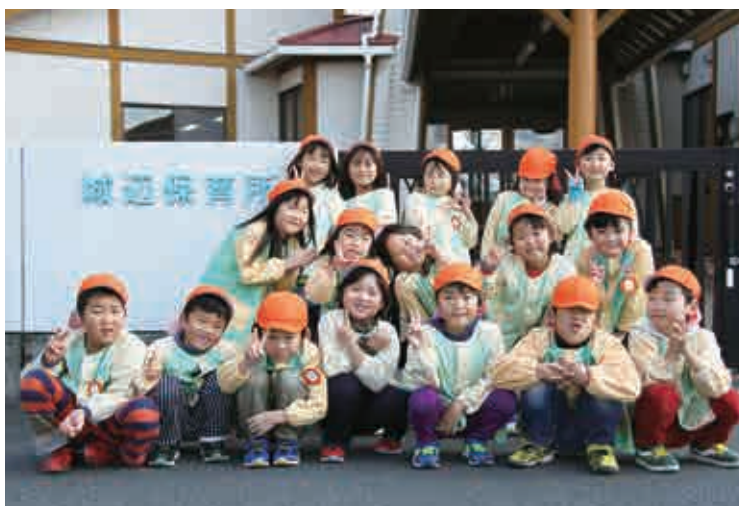
城辺保育所 らいおん組