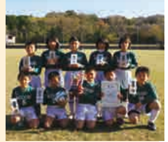
2部B 優勝 緑スポーツ少年団