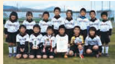
3部優勝 家串・柏・中浦スポーツ少年団