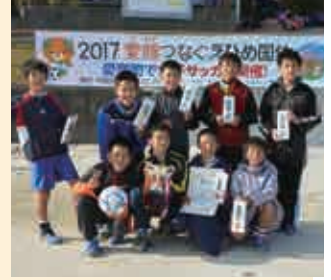
1部B 優勝 緑スポーツ少年団