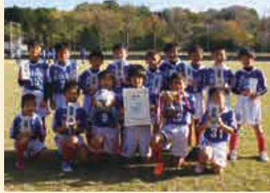
2部A 優勝 城辺少年サッカークラブ