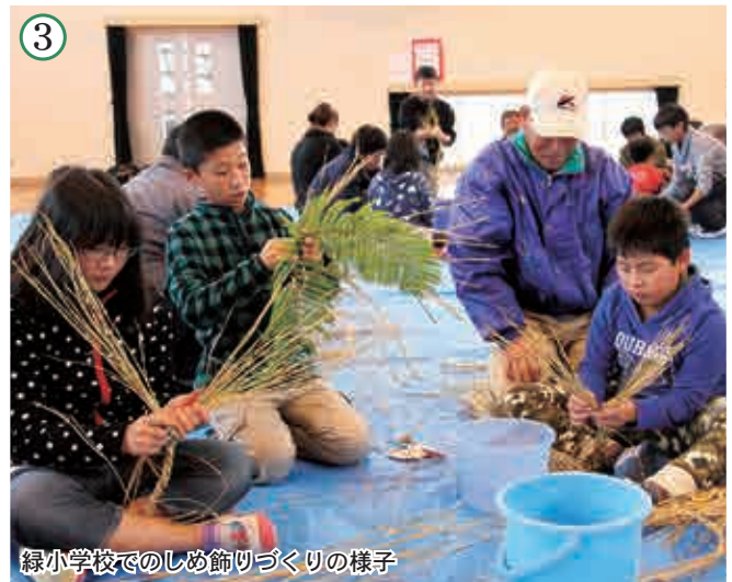
③ 緑小学校でのしめ飾りづくりの様子