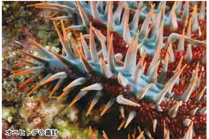
オニヒトデの毒針

12 月 8 日は針供養の日である。日ごろ固い布を刺している針を、軟らかいコンニャクなどに刺して供養する日である。