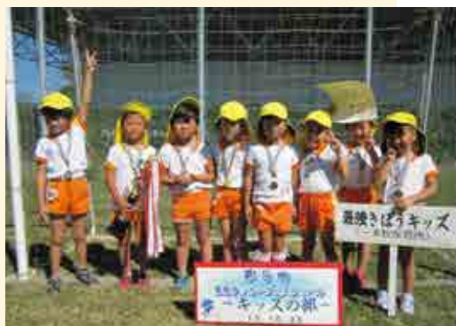
優勝 最強きぼうキッズ