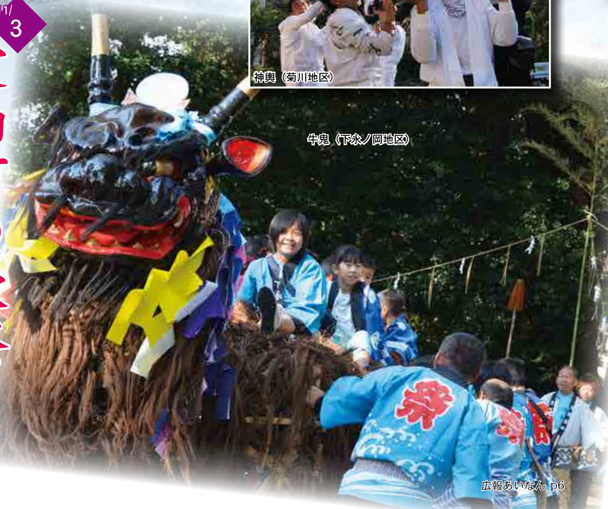
牛鬼 (下永ノ岡地区)