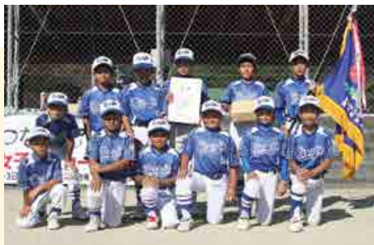
1部優勝 愛南平城ソフトボールクラブ