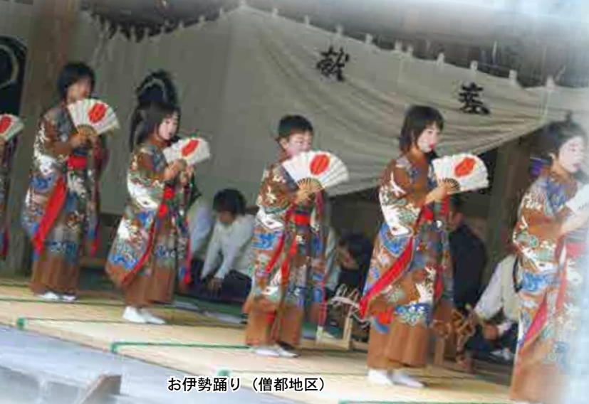
お伊勢踊り (僧都地区)