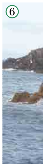
写真1 写真3 11/ 7.8 愛南の文化で 豊かな未来のまちづくり