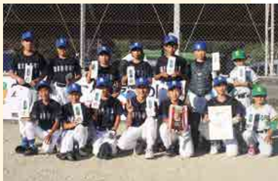
2部優勝 緑スポーツ少年団