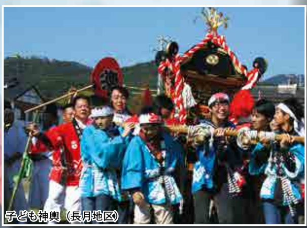
子ども神輿 (長月地区)