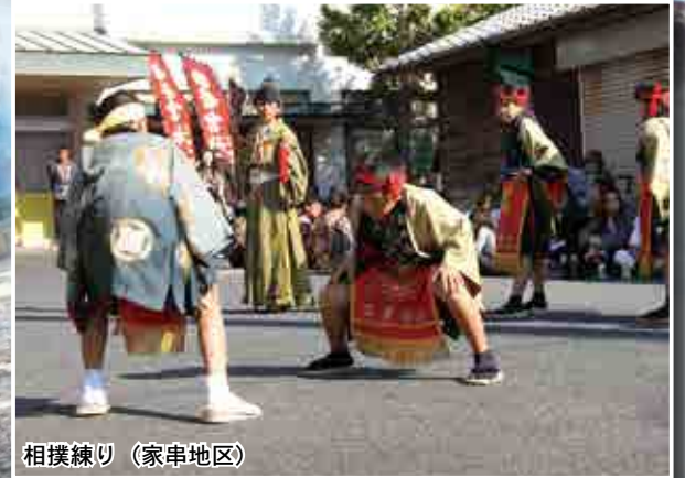
相撲練り (家串地区)