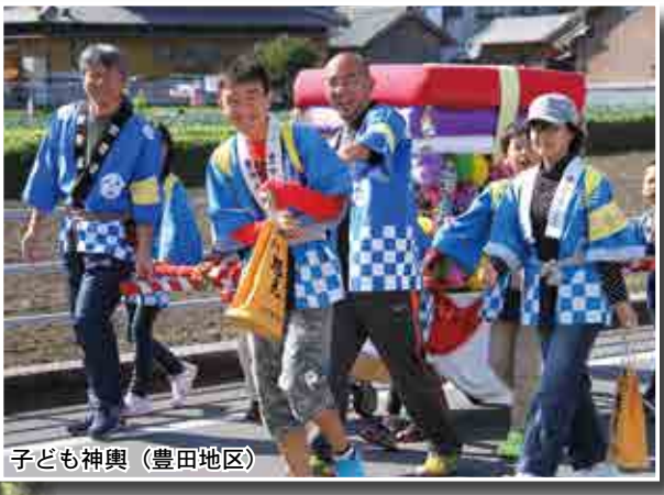
子ども神輿 (豊田地区)