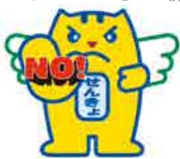
贈らない・求めない・受け取らない