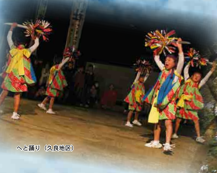
へと踊り (久良地区)