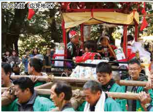
四つ太鼓 (広見地区)