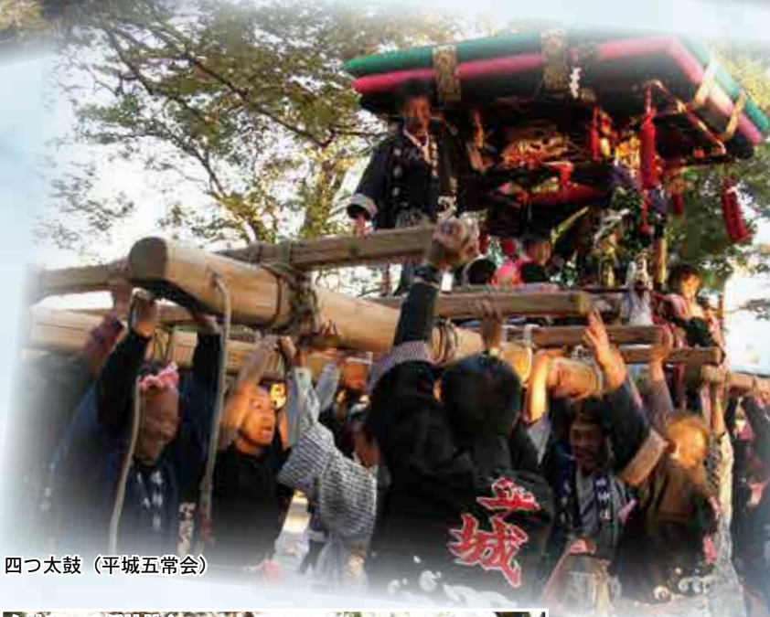
四つ太鼓 (平城五常会)