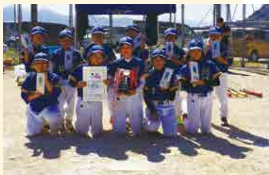
3部優勝 中浦スポーツ少年団