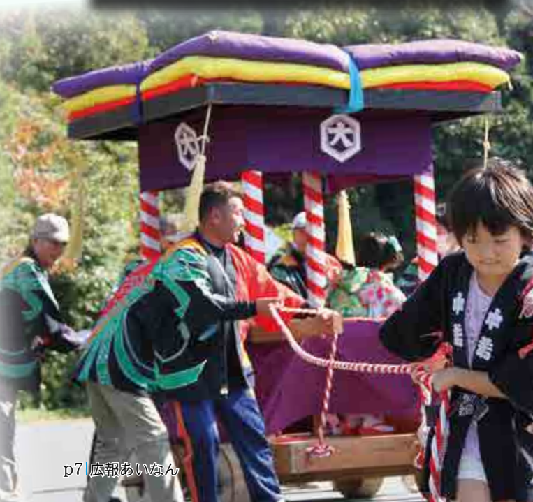
だんじり (一本松地区)

毎年11月3日の文化の日には町内各地区で、農作物の収穫を感謝し、五穀豊穣を祈願して秋祭りが盛大に行われています。すがすがしい秋空の下、子どもからお年寄りまでそれぞれが特色ある衣装や法被を身にもつ、華やかに飾り付けられた四つ太鼓や牛鬼神輿などを担いで練り歩き、鹿舞いや唐獅子などの笛や太鼓の音色が、終日町内に響き渡っていました。各地の秋祭りの様子を紹介します。