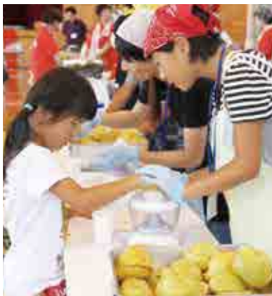
愛南ゴールド生搾り体験

当日は天候にも恵まれて多くの方が会場を訪れ、真珠アケセサリー、こけ玉、絵はがきや竹細工などを作る文化創作体験、ピザ作りや愛南ゴールド生搾りなどの食文化体験で、来場者の皆さんは楽しい一時を過ごしていました。また、野外販売コーナーや田舎レストランも大変好評でした。