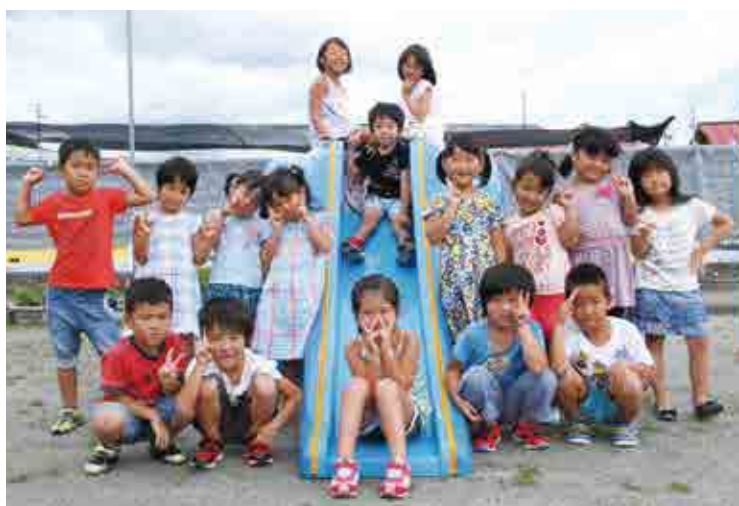
城辺保育所 らいおん組