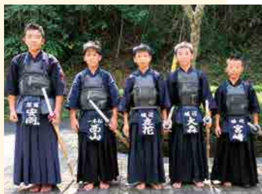
小学生個人戦入賞者