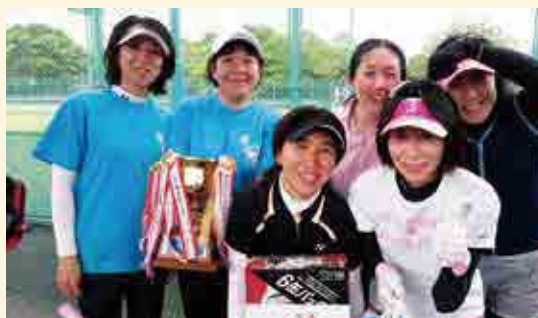
愛南テニスクラブの皆さん

また、中学生の部(8/1、2)には中学2年生以下の18チームが参加しました。本町関係では、本大会優勝の大洲北中と引き分けるなど、予選リーグを無敗で終えながら得失点差で2位グループに回った城辺中学校の5位が最高成績でした。