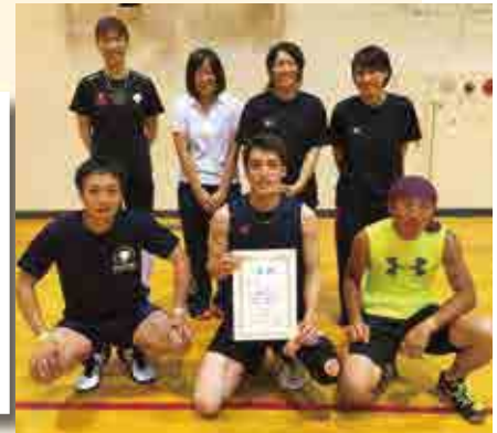
優勝 南宇和クラブ