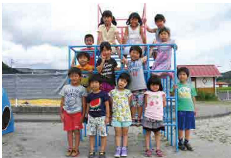
城辺保育所 きりん組