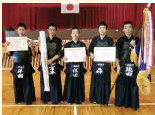
中学生男子団体戦優勝 一本松中