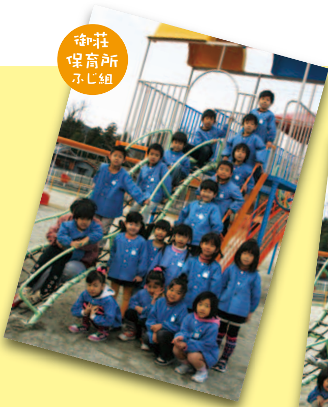
御莊 保育所 ふじ組