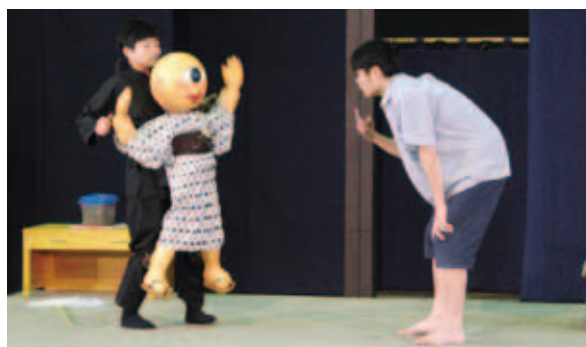
一つ目小僧が登場!「劇団風の子」によるちょっぴり怖くて楽しいお芝居のひとつです。 (12/15~16) 【P23参照】