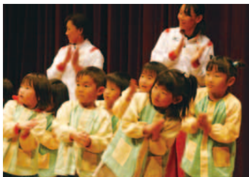
「食育推進大会」で、元気に食育ダンスを踊る城辺保育所の子ども達です。 (12/19) 【P17参照】