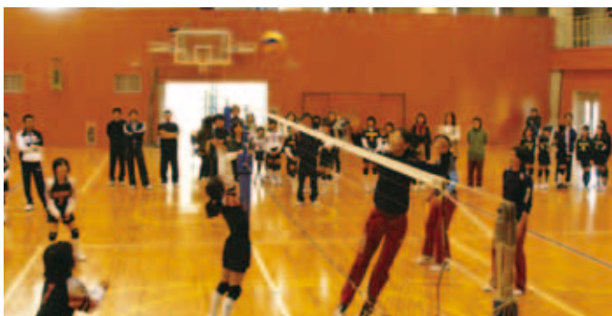
小学生バレーボール教室では、最後に子ども達が、佐伯美香さんら五輪選手とミニゲームで勝負しました。 (12/19) 【P24参照】