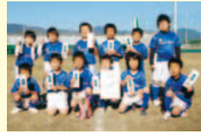
3部優勝 御荘SSアンフィニ