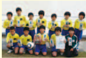
一本松少年サッカークラブA 1部B優勝 緑・僧都スポ小