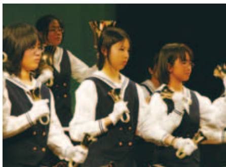
DE・あ・い・21 で行われた「パールイルミネーション」で、松山の東雲学園ハンドベル部の皆さんが、素晴らしい演奏を披露しました。 (12/18) 【P22参照】