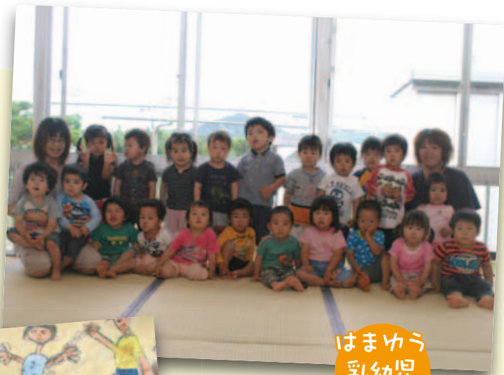
はまゆー 乳幼児 保育所