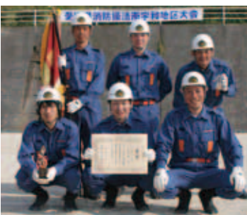
ポンプ車の部優勝 城辺方面隊 第1分団城辺下支部