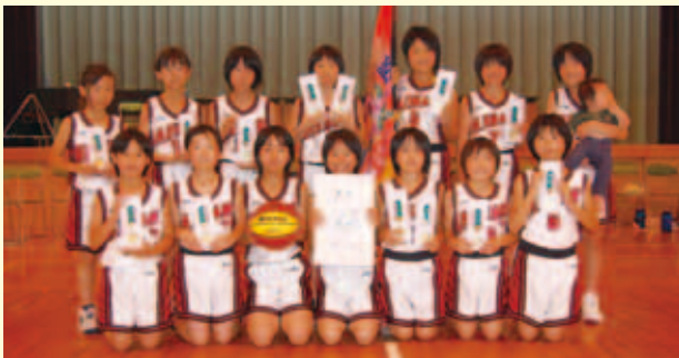
優勝 愛南ミニバスケットボールクラブ