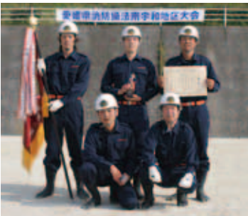
小型ポンプの部優勝 城辺方面隊 第2分団深浦支部