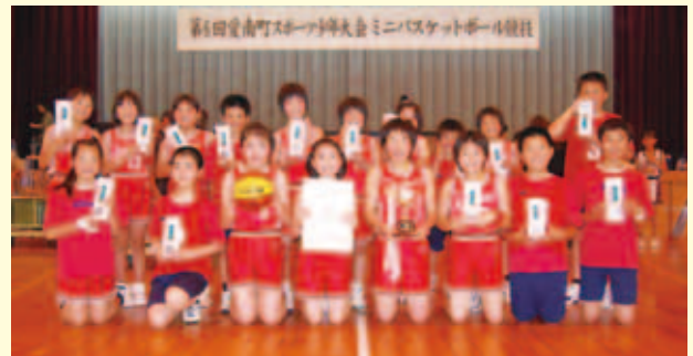
準優勝 赤水スポーツ少年団