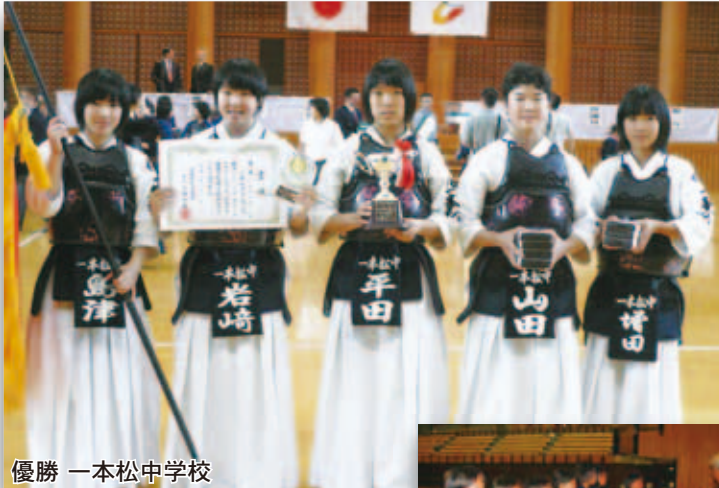
優勝 一本松中学校

愛南町の持つ魅力をご紹介します。 皆様からの掲載依頼など、気軽に情報をお寄せください。