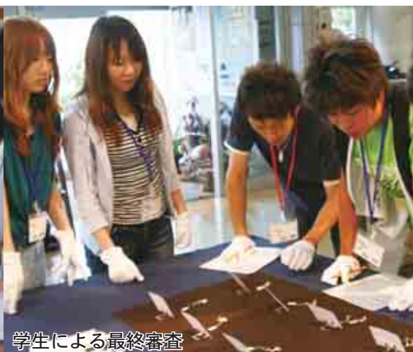
学生による最終審査