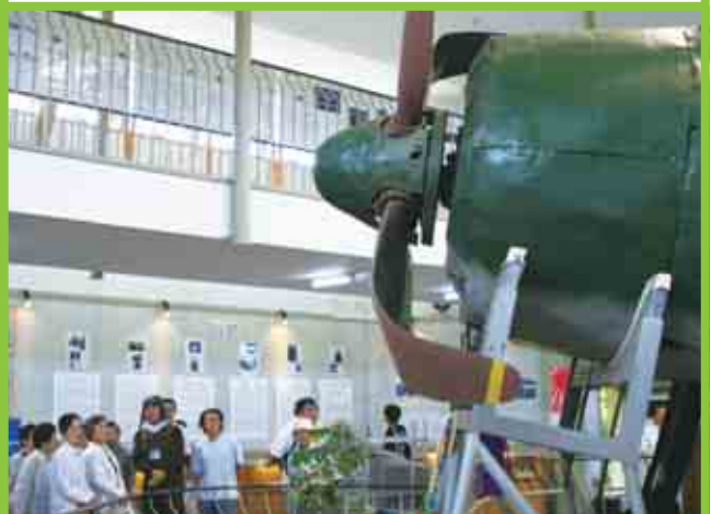
日本で唯一の現存機「紫電改」の引揚げ30周年を記念した特別展示「あいなんからの祈り」。10月18日まで開催しています。(7/19)

表紙の写真コメント 紫電改引揚げ30周年記念イベント「あいなんからの祈り」オープニングセレモニーで、見事なばちさばきを見せてくれた福浦小学校の「風の子太鼓」のみなさんです。