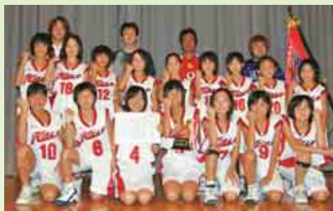
優勝 平城スポーツ少年団ミニバスクラブ

宇和島市総合体育館で開催された「柴田杯ミニバスケットボール大会」で平城スポーツ少年団ミニバスクラブが南予の強豪チームを破り初めて優勝しました。