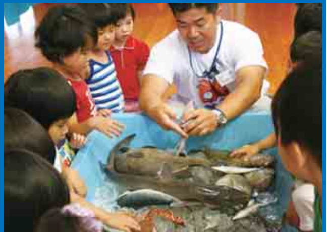
(6/19)城辺保育所で「親子でいっしょに『ぎょしょくの日』」が開催されました。(P4参照)