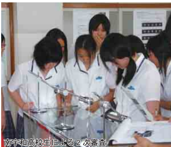
南宇和高校生による2次審査