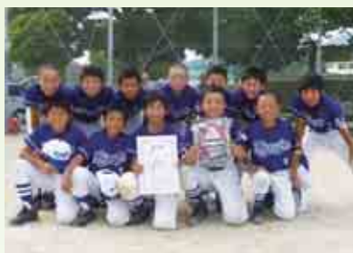
高学年の部優勝 平城スポーツ少年団