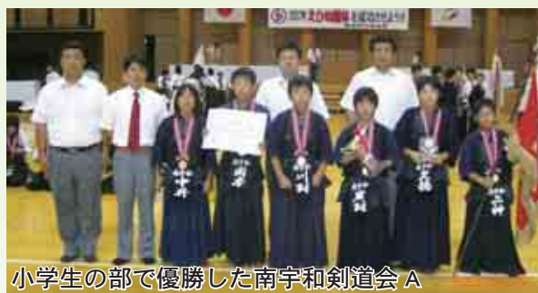
小学生の部で優勝した南宇和剣道会 A