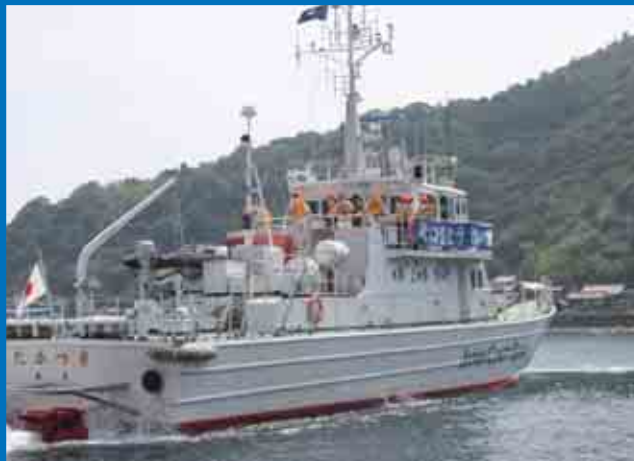
(6/15)放置船合同パトロールに参加した宇和島海上保安部の巡視船「たかつき」から放置防止の呼びかけを行いました。(P11参照)