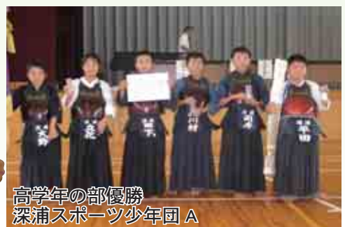
高学年の部優勝 深浦スポーツ少年団 A