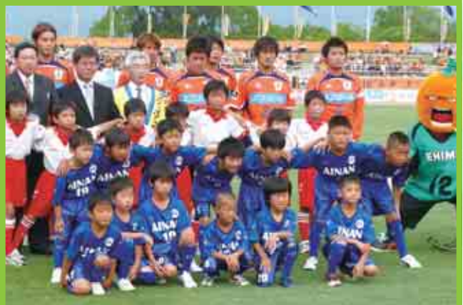
「御荘サッカースクール」の子どもたちが、ニンジニアスタジアム(松山市)で開催された愛媛FCの愛南町マッチタウンでエスコートキッズを務めました。(6/27)