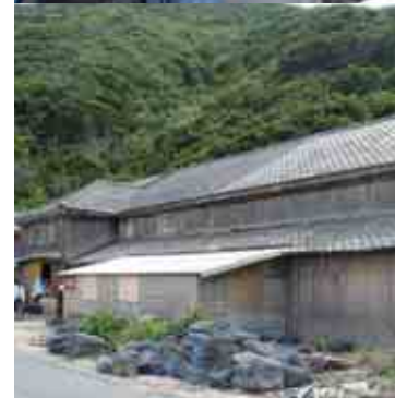
網代魚類製造家屋