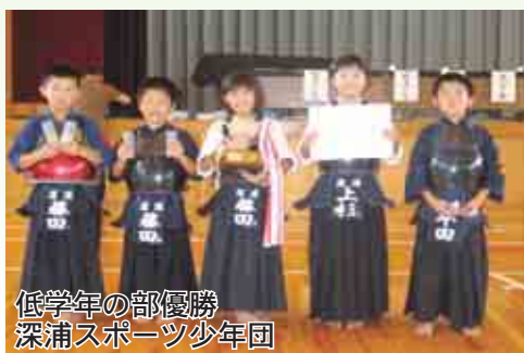
低学年の部優勝 深浦スポーツ少年団