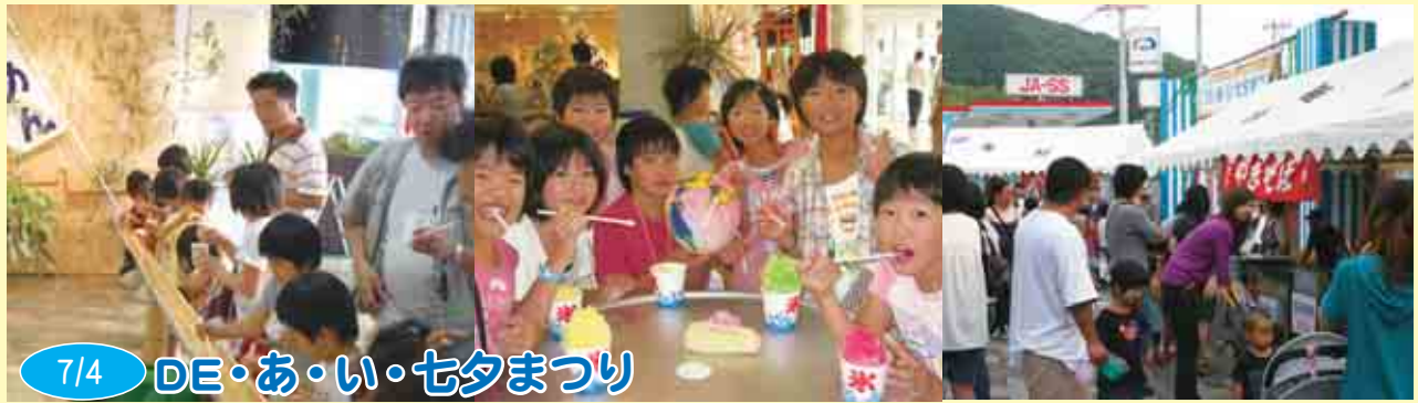
7/4 DE・あ・い・七夕まつり

DE・あ・い・21で、毎年恒例の「DE・あ・い・七夕まつり」が開催されました。特設ステージでは高校生から壮年グループによるアマチュアバンド5組の演奏があり、イベントを盛り上げてくれました。夜市ではカツオのハンバーグや「由良の媛っ子地鶏」の焼き鳥など特産品が出品され、館内では巨大そうめん流しやスイカ割りなどが行われました。晴天に恵まれたこの日は、約450名の来場者で大いに賑わいました。