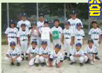
低学年の部優勝 東海ソフトボールクラブ