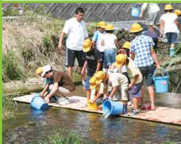
僧都小学校の児童14名が、僧都川でアマゴ2000匹を放流しました。(7/6)