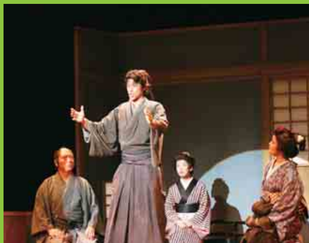
劇団わらび座によるミュージカル「龍馬!」が、御荘文化センターで公演されました。(6/25)