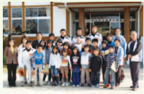
満倉小学校での交流の様子