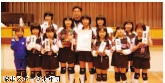
家串スポーツ少年団