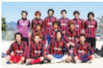
3部 ひろくんとゆかいな仲間たち