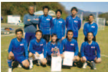
4部 ティーチャーズ