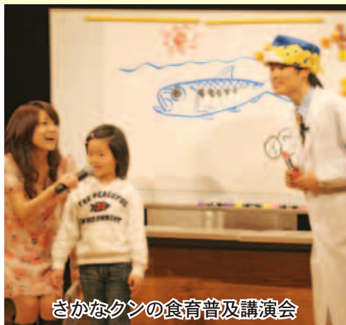
さかなクンの食育普及講演会

産業の振興については、三越松山店での愛南産直市や東京都のアンテナショップ等を活用した更なる販路拡大に努めていきます。