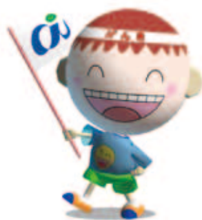
健康キャラクター げんきくん