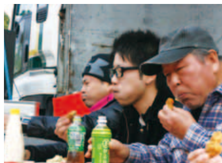
「うまいもん市inあいなん」で行われた「かき早食い競争」の様子です。(2/6) 【P7参照】