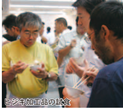
ヒジキ加工品の試食