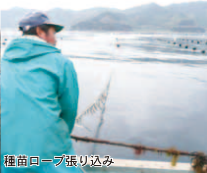
種苗ロープ張り込み