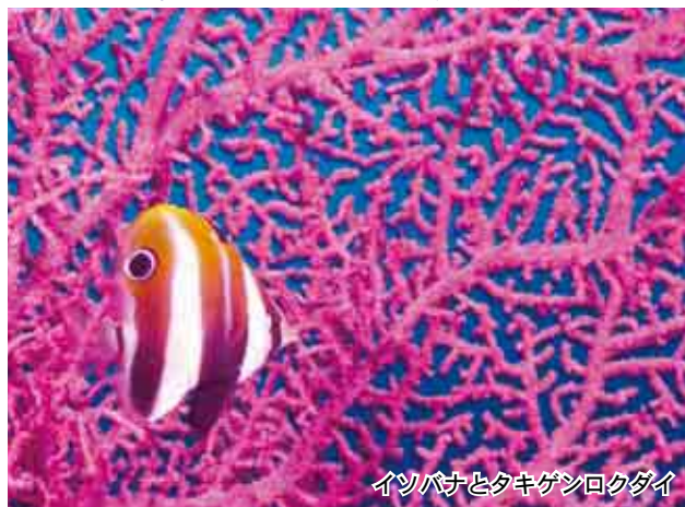
イソバナとタキゲンロクダイ

桜の花が各地で満開になり、春の訪れを告げている。海の中の季節は陸上よりも 2 か月ほど遅れるため、まだまだ厳しい冬である。