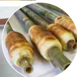
子供たちが 焼き上げた パーム クーヘン