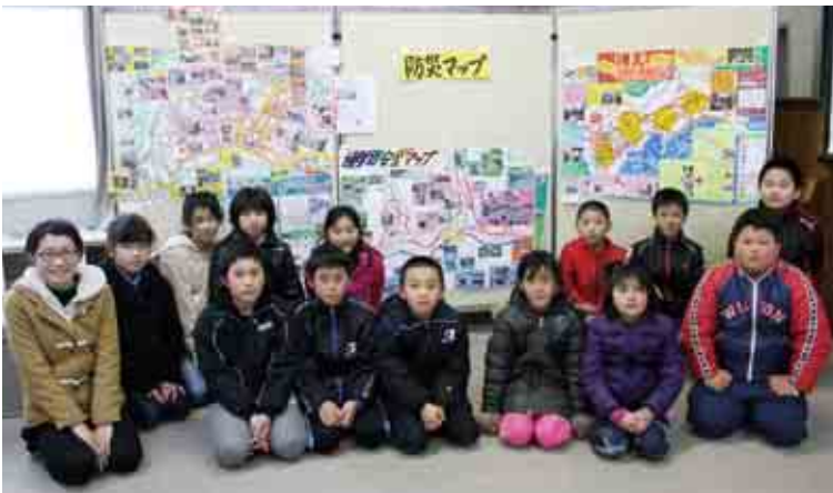
受賞した3作品と福浦小児童の皆さん

一般社団法人日本損害保険協会などが主催する「第11回小学生のぼうさい探検隊マップコンクール」(応募作品2,267点)で、福浦小学校3、4年生4名(チーム名「風の子ダイヤモンズ」)が作成した『樽見自助・共助マップ』が、上位3賞の一つ「消防庁長官賞」に選ばれたなど、町内小学校の5作品が入賞しました。