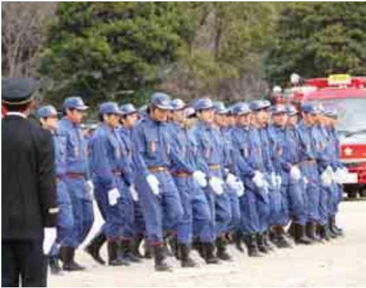
御荘方面隊による小隊訓練

型ポンプ操法を、一本松方面隊第2分団広見支部がポンプ車操法を披露しました。また、柏小、平城小、城辺小、一本松小、福浦小の少年消防クラブによる人員服装点検もあり、各クラブがそれぞれの隊長の号令に合わせた元気の良い団体行動を見せました。このほか、消防団活動に功績のあった団員に対して表彰状の授与と感謝状の贈呈を行いました。当日表彰の榮譽を受けられた方々は次のとおりです。