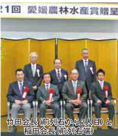
竹田会長(前列右から2人目)と稲田会長(前列右端)