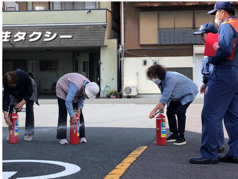
令和6年5月15日に開催した「消火・避難訓練」