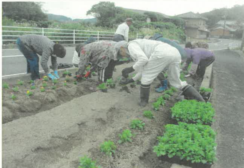
県道花壇花植え (花いっぱい運動)