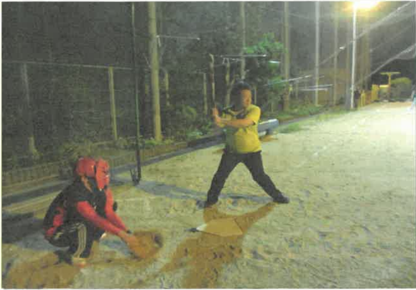
長月ソフトボール ナイターリーグ大会