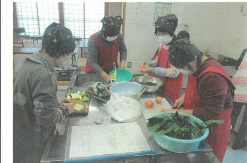
ぎょしょく料理教室