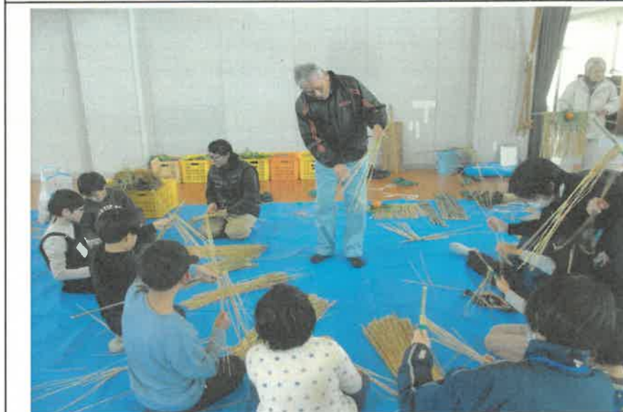
世代交流しめ飾り