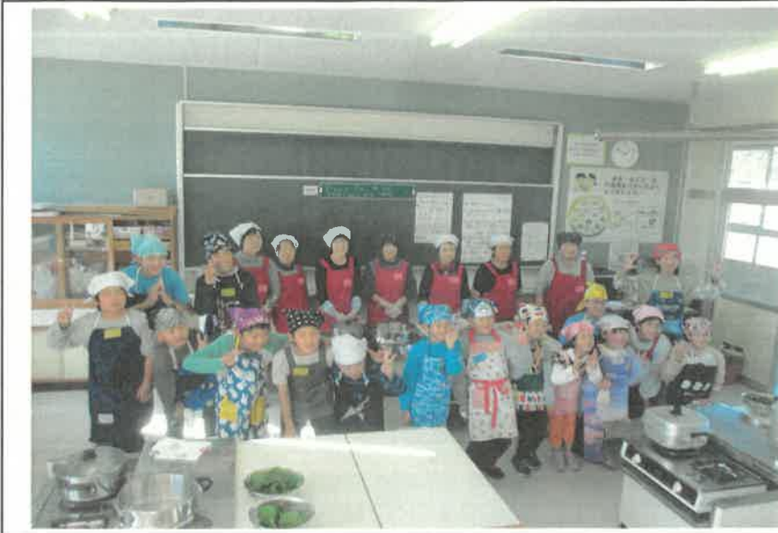
ふれあいサロン 児童との交流会