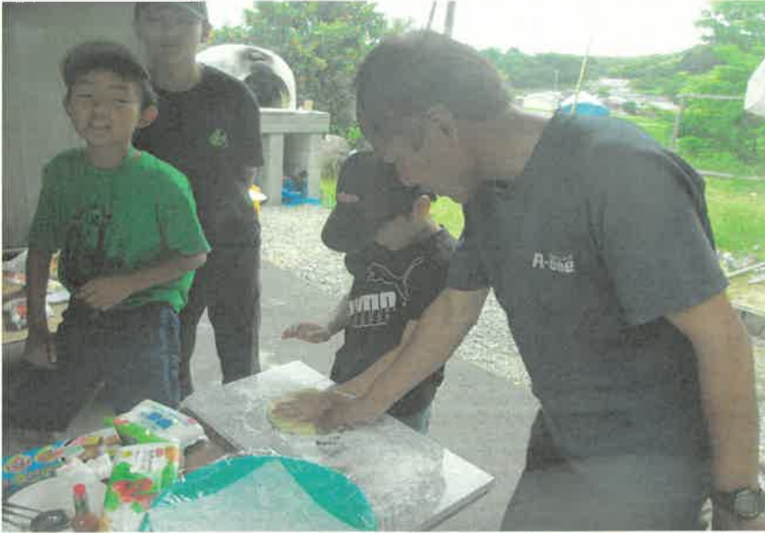
長月夢の森教室 (ピザ焼き体験)