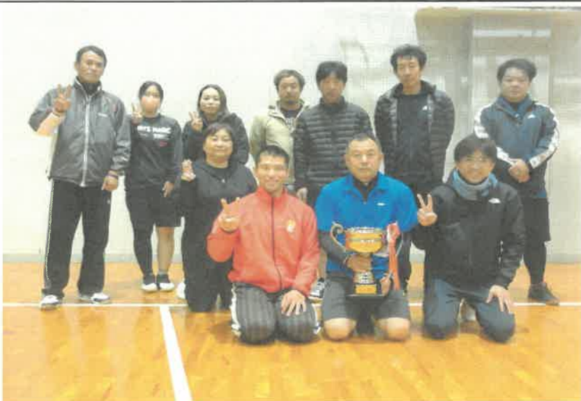
長月まほろばカップ ソフトバレーボール大会