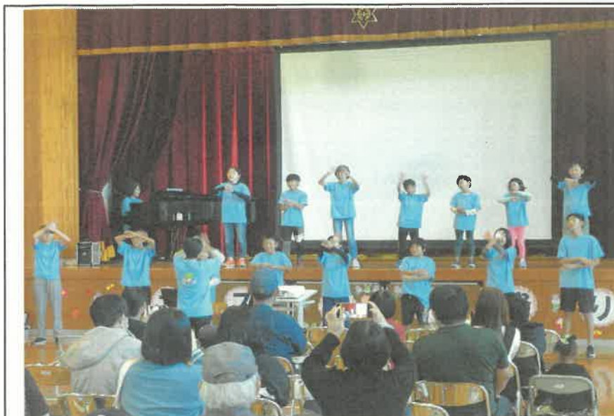
長月コスモスまつり