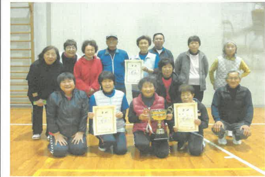
長月まほろばカップ ラケットテニス大会