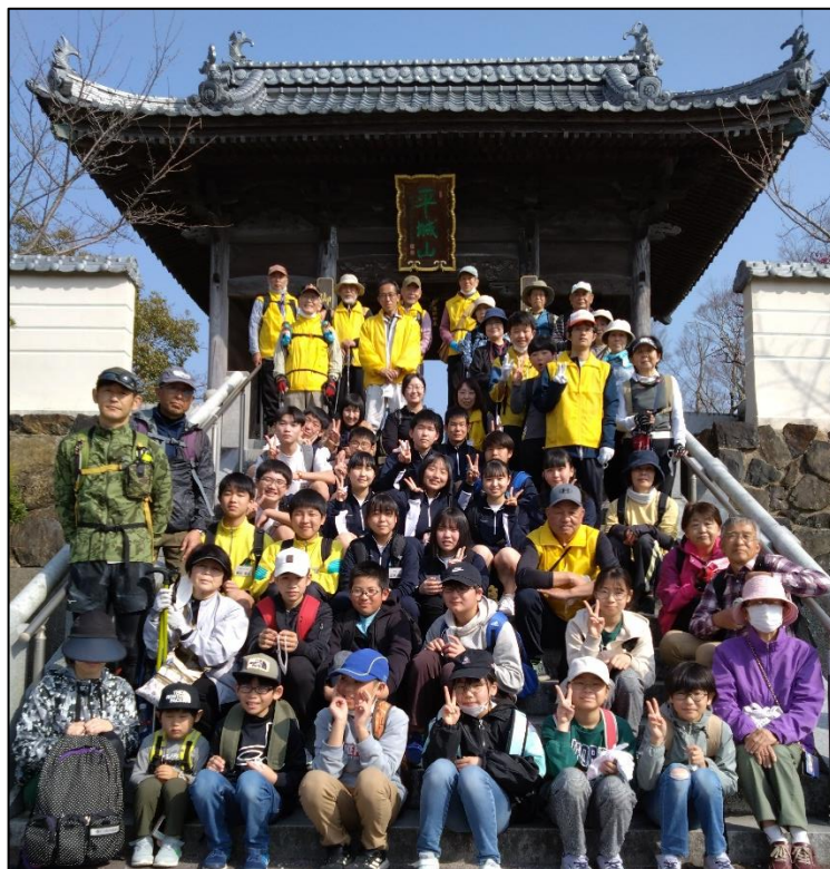
令和5年3月11日に開催した健康ウォーク～ミニ四国巡り