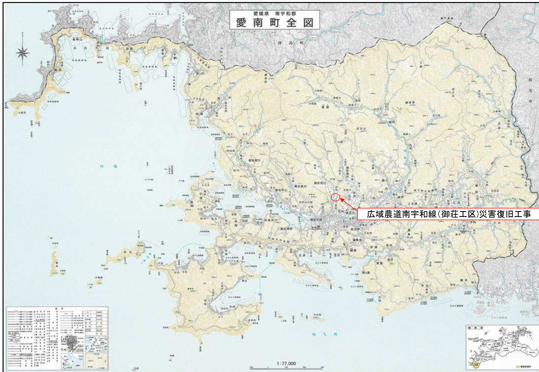
「この地図は、国土地理院長の承認を得て、同院発行の7万7千分の1地形図を複製したものである。（承認番号 平16四復、第57号）」を加工したものの。