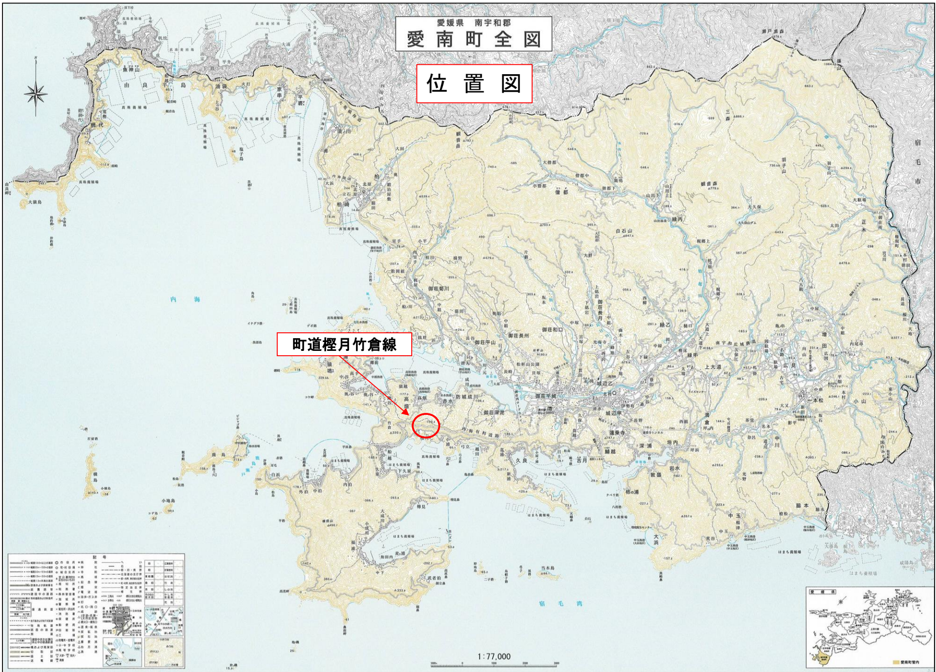
「この地図は、国土地理院長の承認を得て、同院発行の7万7千分の1地形図を複製したものである。(承認番号 平16四複 第57号)」を加工したものである。」