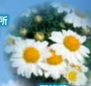
野路菊 (11月中旬頃開花)