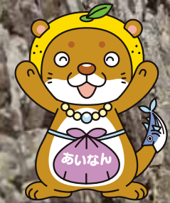
愛南町ご当地キャラクター「あいなんくん」

〒798-4196 愛媛県南宇和郡愛南町城辺甲2420番地 ☎0895-72-1211 FAX 0895-72-1214 http://www.town.ainan.ehime.jp/