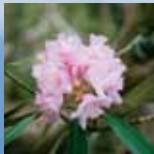
▲シャクナゲ ◀アケボノツツジ