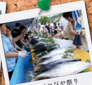
愛南びやびや祭り