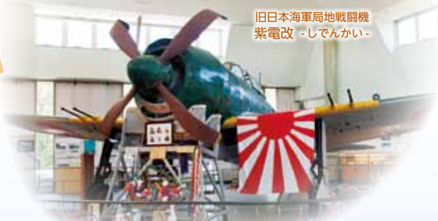
旧日本海軍局地戦闘機 紫電改 -しでんかい-