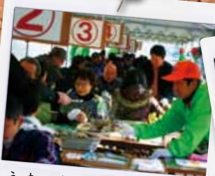
うまいもん市 in あいなん