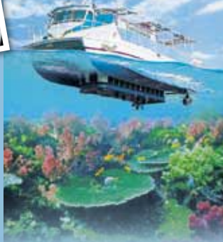
海中展望船「ガイアナ2」 海中展望船「ユメカイナ」